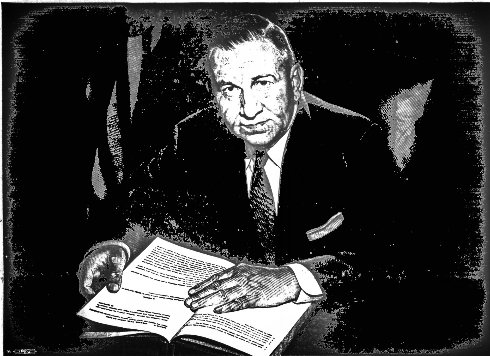
"When I was a kid, I fired the furnace in the church, sold magazines and had me a newspaper route," Paul Powell—twice named "Outstanding Legislator of Illinois" by newspaper correspondents who cover the Illinois General Assembly.