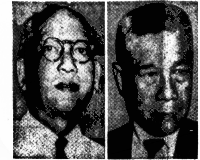
Kairėje matomas Phan Khac Suu, paskirtas Vietnamu prezidentu, o dešinėje matomas Tran Van Huong, iki šio mėto buvęs Saigono mēras, dabar paskirtas nauju Vietnamo premjeru. Gen. Khanh yra kariuomenės vadas. Jis perduos vyriausybę civiliams, kai tik naujoji valdžia sugebės susiorganizuoti.

Daktarai, kurie ligoninėje gydo japonų atsistatydinusių ministrų pirmininką praneša, kad Ikeda gali išbūti ligoninėje šešis mėnesius. Tiek laiko gali užtrukti, kol jis vėl galės vartoti savo balsą. Gerklės anglys turi vežio žymių ir jo gydymui reikišią vartoti radiaciją.