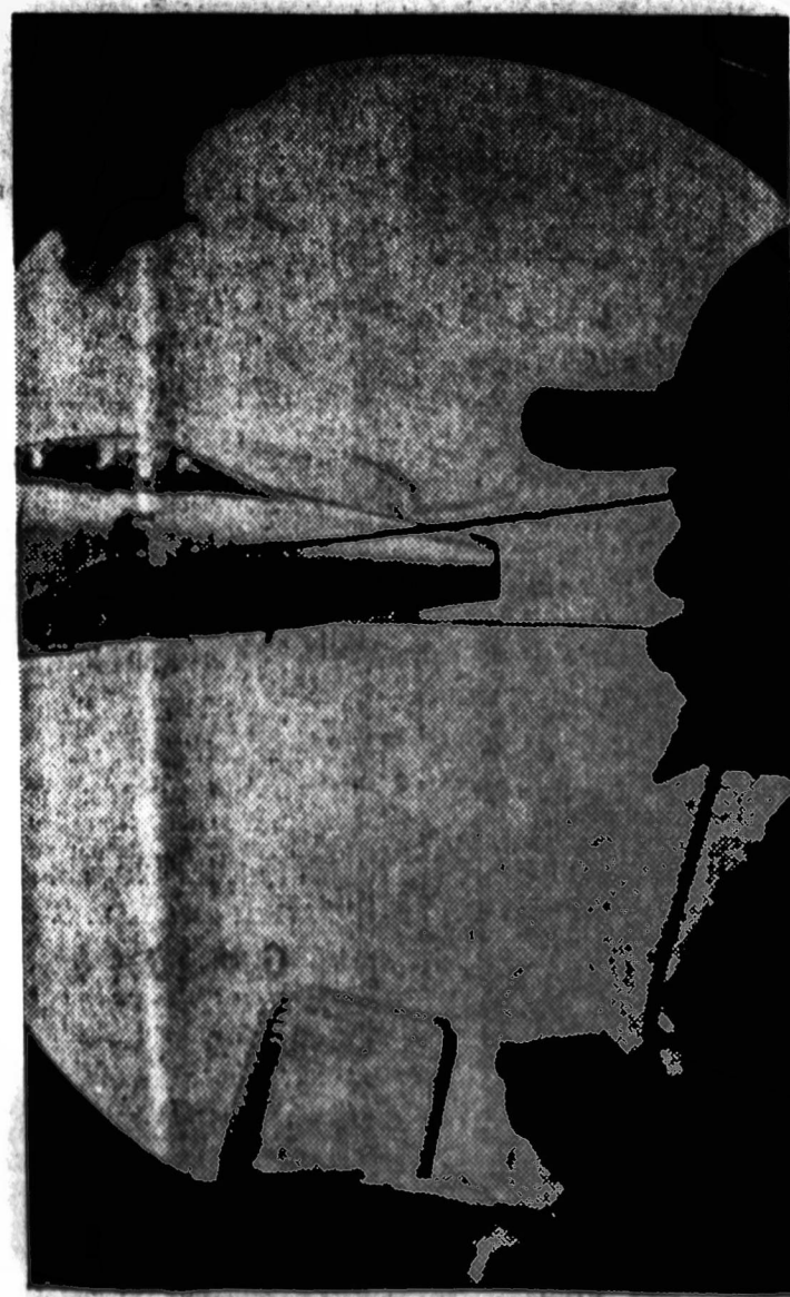
Didysis Amerikos lietuvis — tenkas padengė pilsa gazolinį į greitai skrendantį naikintuvą. Pro langą žūrie specialistas prižiūri gazolinį įpylimą, kad neatstiktų neteisai.