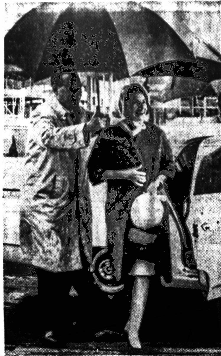
Prezidento žmona aktyviai dalyvauja rinkiminėje kampanijoje. Paieškose matome ponį Johnson, smarkiam lietuvi slaučiant, Austin aerodrome einančią lipni į laukiantį lėktuvą.

Oro paštu į Pietų ir Centro Ameriką, Afriką ir Artimuosius bei Tolimuosius Rytus išsiųsti iki gruodžio 10 dienos, o į Europą iki gruodžio 15 d.