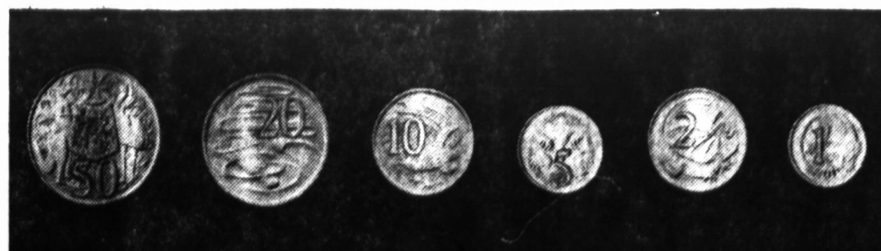
Ateinandais metais australiečiai pradės vartoti dešimties sistema pagrįstus pinigus. Iki šio metu Australijoje buvo vartojami britų svarai ir šilingai. Naujai nukalti australiečių pinigai turės būdingų vietos gyvulių vaizdus, matomus šiame paveiksle.