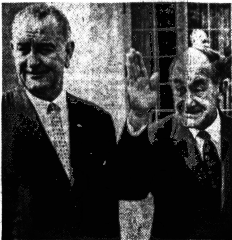
Prezidentas Lyndon B. Johnson gana ilgai kalbėjosi su britų užsienio reikalų ministru Gordon Walker, atvažiuoju į Washingtoną ir pasižadėjusiu bendradarbiauti su JAV.