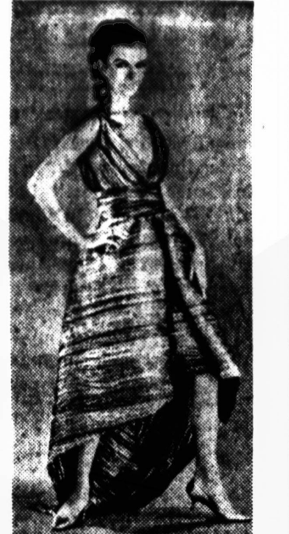
Šį rudenį Paryžiaus moterys baliuose pasirodys su šitokiomis sukniomis, siūtomis iš labai ryškių spalvų medžiagos.