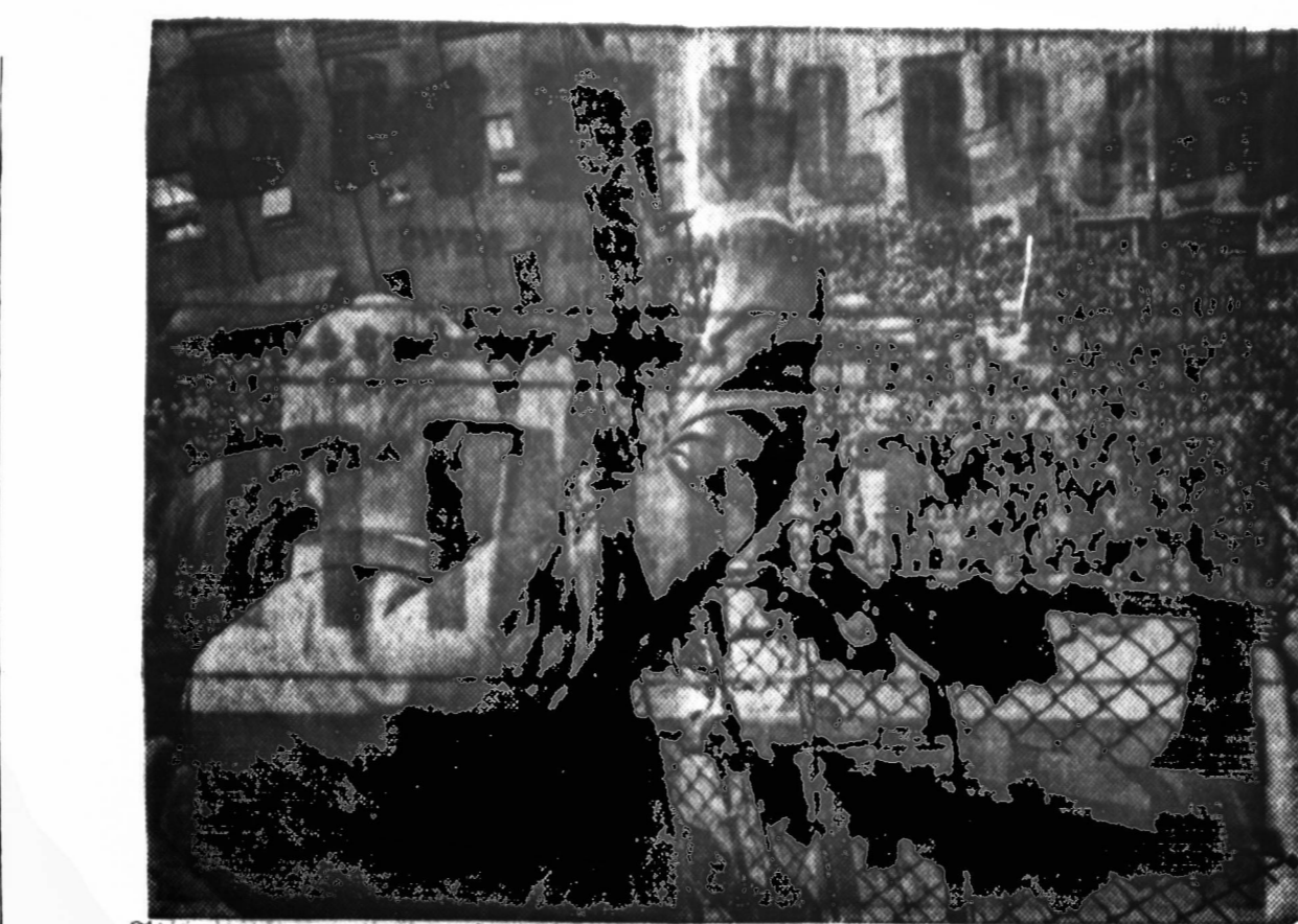
Rinkimins kampanija, kai eina prie sėbels. Paveiklo roptame sen. Goldwater, Harrisburg, Pa. mieste stovėjančiantį su senatoriaus likusiu atėjusia minia.

aukos. Komiteto narių ryžtas vienam ir svarbiausiam tikslui — tėvynės Lietuvos vardui išgarsinti rugpjūčio mėn. 23 dieną tapo ne tik neapvilta, bet buvo ne vien savųjų apvalni-kuotas garbės ir pasididžiavimo vainiku.