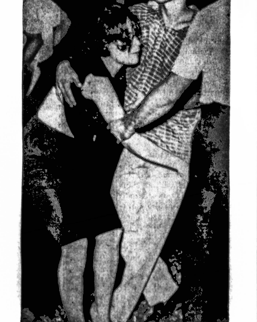
Maža dailis neramų Puerto Rico studentų pradėjo kelti triukšmą San Juan universitete. Rektoriui uždavė universitete, kol rinkimai ir karštis praėis. Bet studentai ir toliau triukšmavo. Pavaisėsi matome policininką, norintį nuvesti įsikalčiavusių studentų ir studentę, norintį apginti ję nuo policijos.