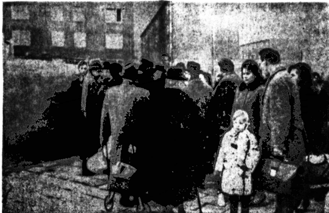
Ilgiausia vakarų Berlyno gyventojų eilė, apsilikusių maisto ir drabužių ryšuliais, laukia prie vartų, kad galėtų nuvykti į rusų okupuotą Berlyną ir pasimatyti su ten komunistų atkariams gimimams. Nuvykusieji turės teisę pasilikti 17 valandų rytų Berlyne. Iš viso gaus leidimus apie 940,000 laisvų vokiečių. Tuo tarpu komunistai nieko neišleidžia iš Rytų Vokietijos.

RAGUSA, Sicilija. — Smarkus uraganas užmušė keturis ir šimtus sužėdė. Sunaikinta daug namų ir padaryta kitų nuostolių. Labiausiai nukentėjo Santa Croce Camerina miestas.