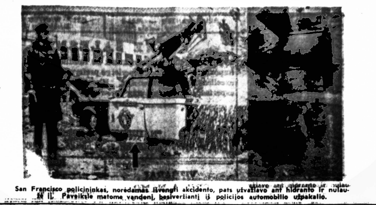
San Francisco policininkas, norėdamas išvengti akcidento, pats užvažiuo ant hidranto ir nulauso II. Pavyksite matoma vandeniui, besiveržiantį iš policijos automobilio užpakalio.