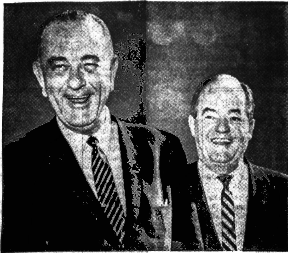
Rinkimus laimėjo JAV Demokratai. Kairėje matome Lyndon B. Johnsoną, naujai išrinktą JAV prezidentą, o dešinėje stovi Hubert H. Humphrey, JAV viceprezidentas. Trečiadienio rytą Humphrey išskrido į Texas, kad galėtų pasitarti su Lyndon B. Johnsonu apie tolimesnius valstybės tvarkymo reikalus.

Respublikonizmas Amerikai yra reikalingas, kaip dviejų partijų sistemos dalis. Paskutiniuose rinkimuose balsuotojai pasisakė ne tiek prieš partiją, kiek prieš jos kandidatą ir prezidentus. Goldwateris gavo mažiau balsų negu laimėję respublikonų senatoriai ir atstovų rūmų nariai. Daugelyje vietų jis gavo mažiau balsų negu pralaimėję respublikonai kandidatavę į mažesnius postus. Tas rodo, kad respublikonai turi būti dėkingi už savo triuškinantį pralaimėjimą tikrai kandidatui ir prezidentui.