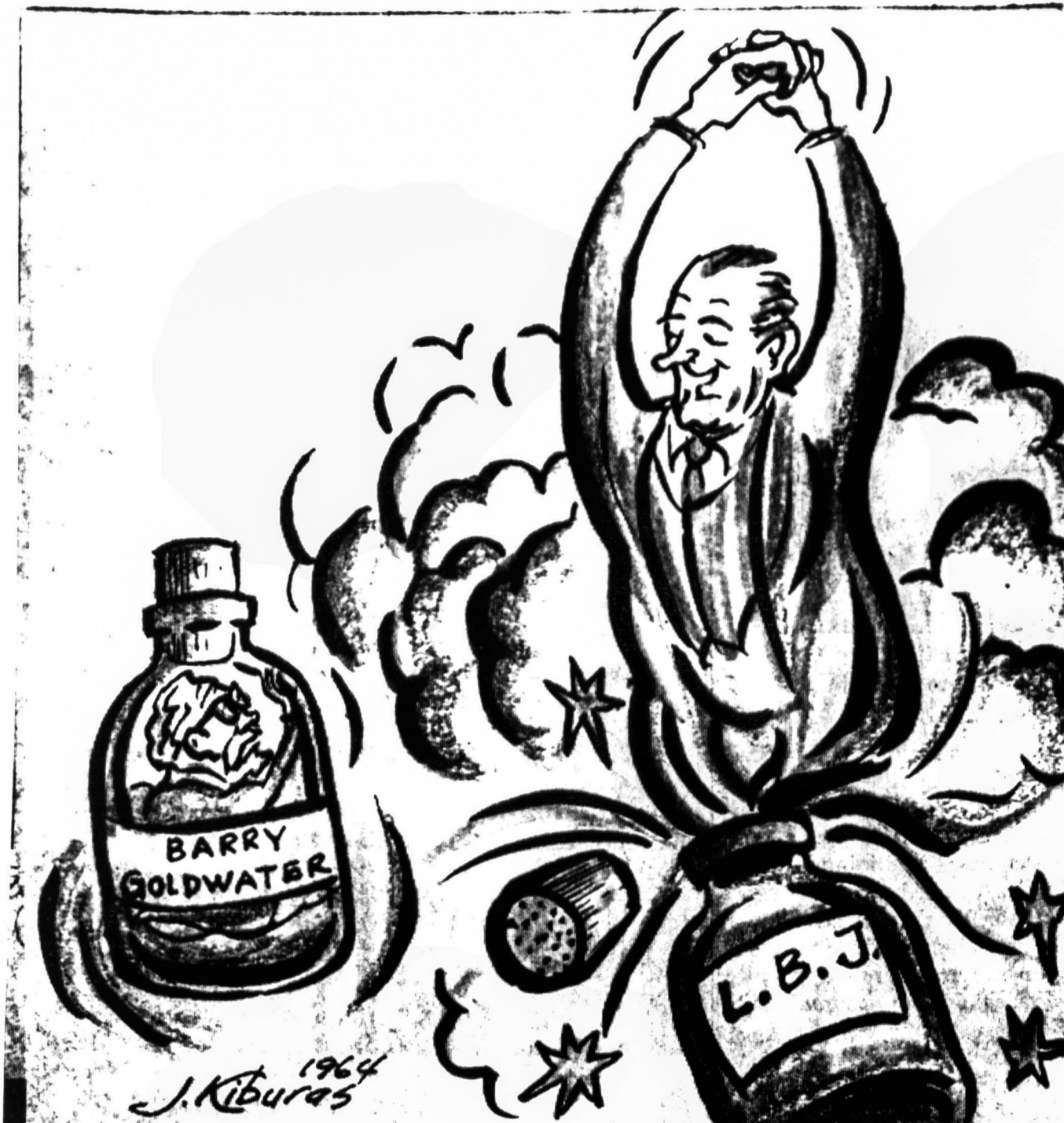
Vanduo, kad ir auksinis, kamščio neišmušė. Matyt, kad reikia stipresnio "stofo"