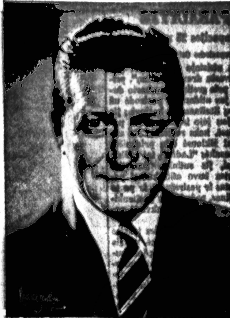
Gubernatorius Otto Kerner