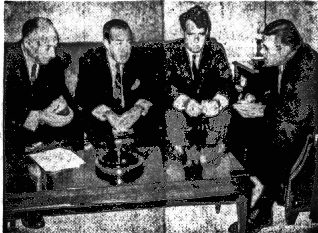
Robert Kennedy, naujai išrinktas senatorius iš New Yorko, pildo savo rinkimų metu duotas pažadas. Jis tuoj aplankė Washingtono gynybos sekretorių Robert S. McNamara (dešinėje), prašydamas, kad nebūtų uždaryta Brooklynje karo laivų statykla. Kartu su Kennedy buvo nurykę sen. Jacob Javits (kairėje) ir New Yorko mэрas Robert Wagner (antras ir kairės).

Senajam prezidentui pabėgus į Peru, Bolivijoje dar vyko kovos tarp sukilusių ir senosios valdžios šalininkų. Kovose žuvo 40 asmenų. Daug buvo sužeista.