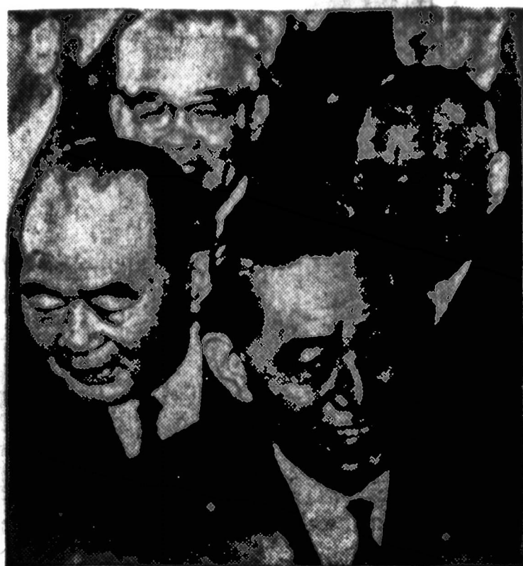
Priekyje matoma Eitaku Sato, naują Japonijos premjerą, į parlamentą įvedėję grupę artimų draugų ir bendradarbių. Buvusiam premjerui susirgus, Sato išpareigotas sudaryti naują kabinetą.

Wilsonas ruošiasi rinkimams Reikia manyti, kad Wilsonas šitokia maža dauguma krašto valdyti negalės. Penki atstovai yra visa valdančiosios partijos persvara. Ateinančiais metais darbičiai greičiausiai atsistatydins ir paskelbs naujus rinkimus. Iki to laiko darbo partija turi įsigyti gyventojų pasitikėjimą ir simpatijas. Daugelis dabar vyriausybės paskelbtų reformų aiškiai rodo, kad šio balsuotojų pasitikėjimo ir bus siekiama per ateinančią laiką. Vyriausybė siūlo padidinti pensijas, įvesti butų nuomos kontrolę, panaikinti kalkuliavimo mokėjimus už sveikatos draudimo patarnavimus ir įvesti skundų įstaigas, kuriuos gyventojai galės pasit-