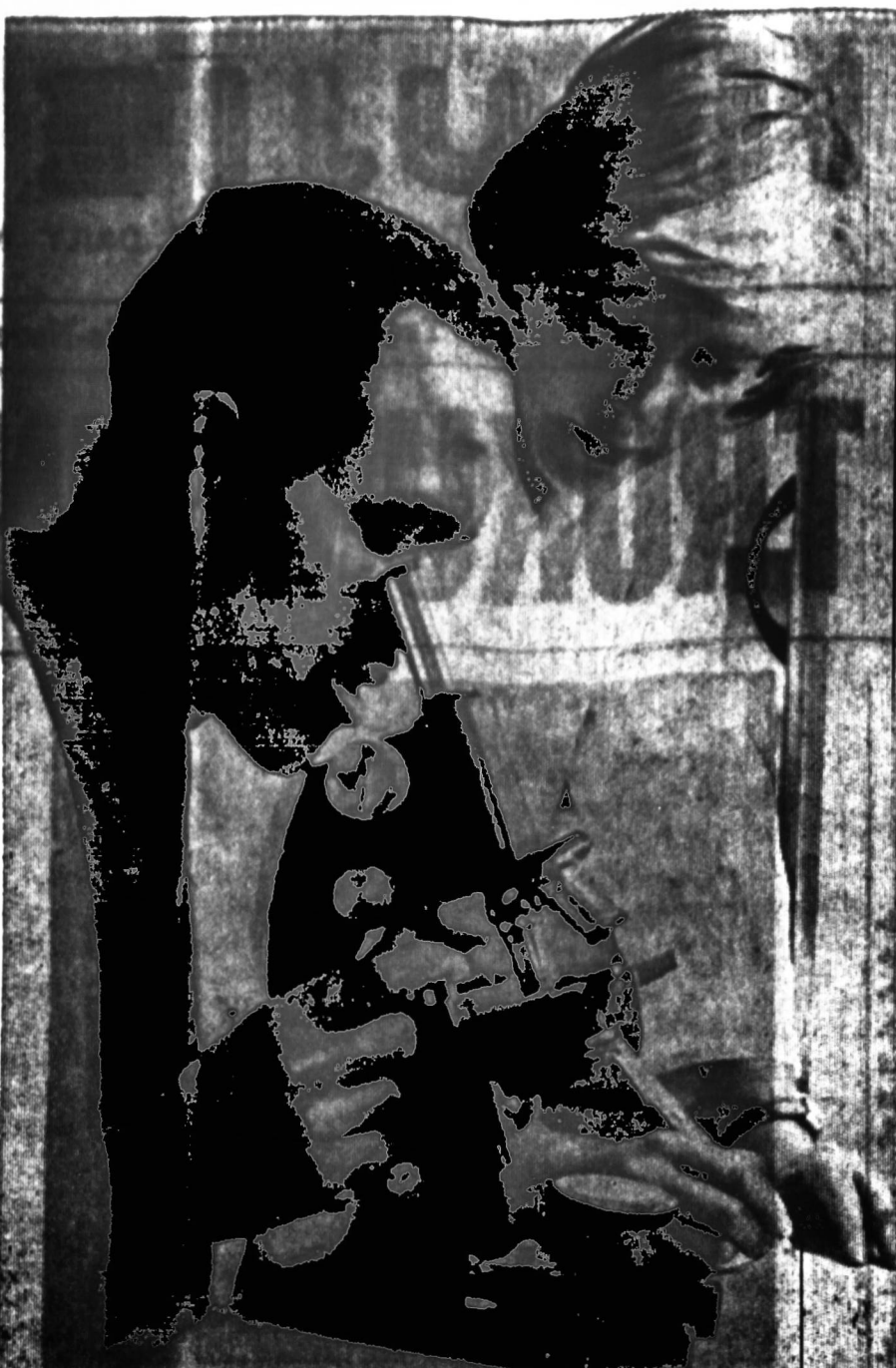
Gabėti ir prasėji Amerikos jaunūmā “Roja” j Talkos Dalin (Pėle Gėrė) ir sūkėti j yvėlėtis tauti mōkytoji sūkėti, kaip lengvāiu ir geriau gyvenū. Pavėikale matome Talkos Dalino narē, jaunā amerikietē, Afrikoje mōkiančią laboratorijos technikā, kaip vartoti mikroskopus ir pažinti pavojingās ligās. Naujai įsteigtos Afrikos ligoninės visai neturi patyrusių laboratorijos technikū.

Tautinū grupū pasirodymuose lietuvius atėstovavo CALM tautinū apkū grupė “Auėrinė” savo mōkytoja L. Smėilėnienė vadovaujama.