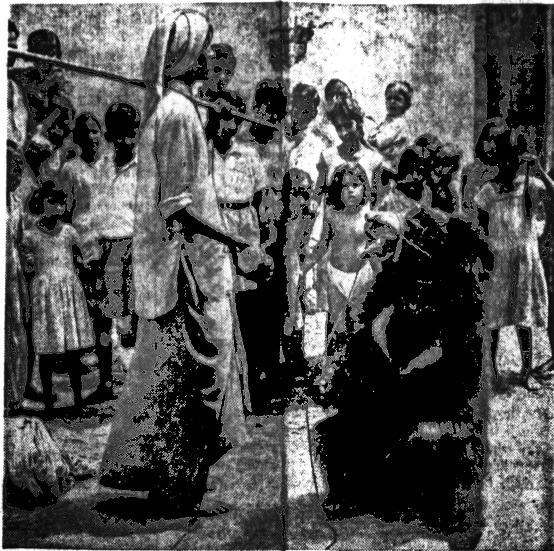
Apmokytą melką šoka Kalkutos gatvėse. Vaikų ir paauglių būrys mėgsta paspoksoti, kai nerangus žvėris parodo mitrumą. Indijos kelių gyventojai, pripratę, užauginę ir išmokinę meškiukus, vyksta į miestus uždarbiauti. Už melkos pakūkimą basas kaimietis renka iš spoksotojų pinigų. Apsaugai, melkos šokinį įverta stipri grandis.

Jau įvyko susistumdymų tarp karštesniųjų demonstracijų dalyvių ir policijos. Sasebo uoste vakar su įvairiais plakatais vaikščiojo apie 15 tūkstančių žmonių, kurie nenori matyti atominio amerikiečių laivo Japonijos uoste.