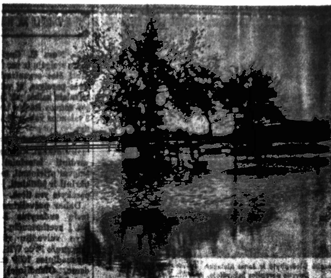
Vakarinesse valstijoje buvo didelės sausros, išdegė daug miškų. Praeitę savaitę kai praplūpo lietus, tai daugelį vietų užliejo ir apėmė. Pavalkite matome Blackwell, Okla., apylinkę, visai pakendusių pakilusiamo Chikaskia upės vandenys.

MOVING PERKRAUSTYMAS IS TOLI IR ARTI Jūs nustebsit pamatę, kokios natūralios spalvos DUMONT TV. J. G. Television Co., 2512 W. 47 St. FRontier 6-1998 Radial • Fonografai • Hi-Fi stereos