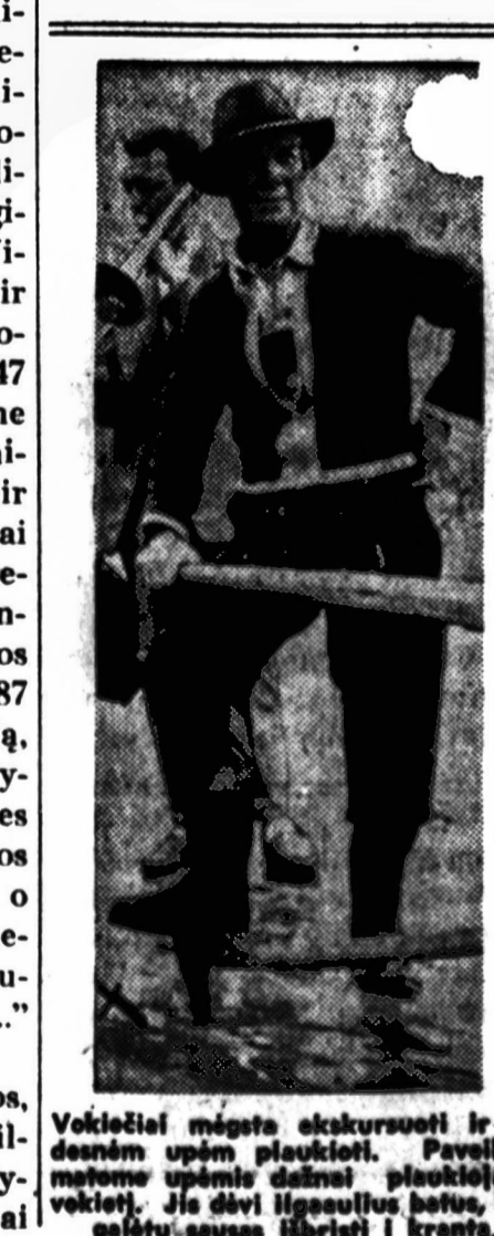
Vokiečiai mėgėta okupuoti ir didesnę užmies dalį. Pavėliko matome upėms duobė plaukiojančių vokiečių. Jis švėi ligonius, betus, kad gėltė suausis išbristi į kraštą.

Kaip matome iš šios citatos, ne lietuviai išgalvojo, kad Vilniaus ir Trakų vaivadijose gyveno lietuvių masė, bet slavai