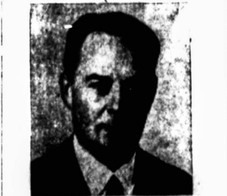
Aleksandras N. Selepin, ligametis Berlio bendradarbis ir Rusijos komjaunimo vadas, paskirtas į kompartijos centro komitetą. Nužudytas Berlyje, Selepinui buvo pavesta sovietų saugumo vadovybė. Jo žiniomis buvo apie pusę milijono gerai ginkluotų ir apmokėtų vyrų. Šiame pažiūrėjime į paskyrę Chruščiovas, bet centro komitetas tada nebuvę įleistas, o dabar patoko į mažiausią unijų komunistų grupę.

SAIGONAS, Pietų Vietnamas. — Kaip anksčiau pranešta, vietnamių didelis miškų valymas pasibaigė netikėtai nesėkmingai. Su septyniais tūkstančiais kareivių apsupose ir bombarduotose vietose buvo rasti tik trys priešo partizanai. Dabar paaiškėjo, kad visi partizanai buvo pasislėpę giliuose tuneliuose. Vyriausybės daliniams besitraukiančius kareivius, šeštadienį tokiu būdu žuvo 10 vietnamių ir 30 buvo sužeisti. Buvo išaiškinti keli giliūs požeminiai tuneliai. Manoma, kad jų yra pilnas miškas. Kai kurie tuneliai yra net trijų aukštų Juose partizanai gyvena ir laiko savo maisto ir amunicijos sandėlius. Vyriausybės aviacija dar kartą lėktuvais puolė miškingą pjlotą ir apmetė padegamomis bombomis įtariamus vietas.