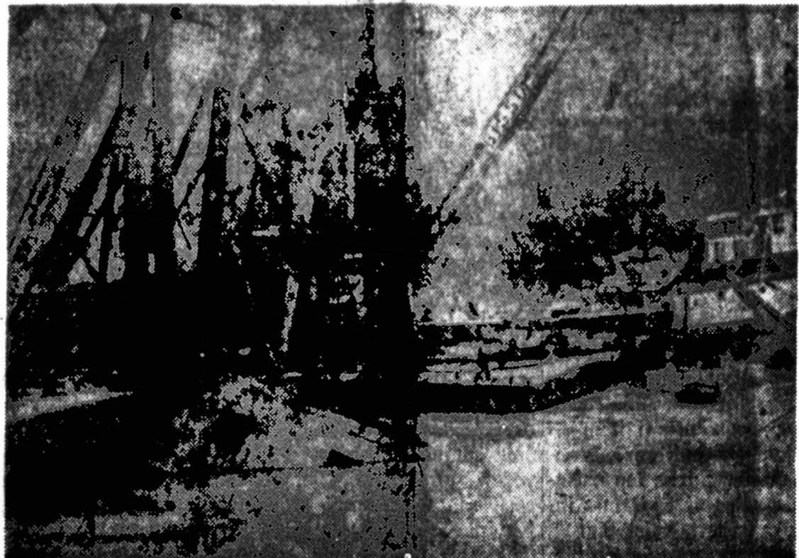
Prieš 102 metų civilinio karo mūšiuose Yazoo upėje, netoli Vicksburgo, Miss., buvo nuskandintas šis plieno plokštėmis apkalta laivas. Šiame žeminyje jis ištrauktas paviršium. Dabar jis eis į muziejų, o žinovai paraisys apie Yazoo pakrantėse vykusius mūšius.

— MEXICO CITY. — Nauja elektros stotis ir užtvanka ant Rio Balsas upės buvo atidaryta Meksikos prezidento Lopez-Mateos. Šie nauji įrenginiai kainavo virš 100 milijonų dolerių. Stotis gamins elektrą apie 10 mil. centrinėje Meksikoje gyvenančių žmonių.