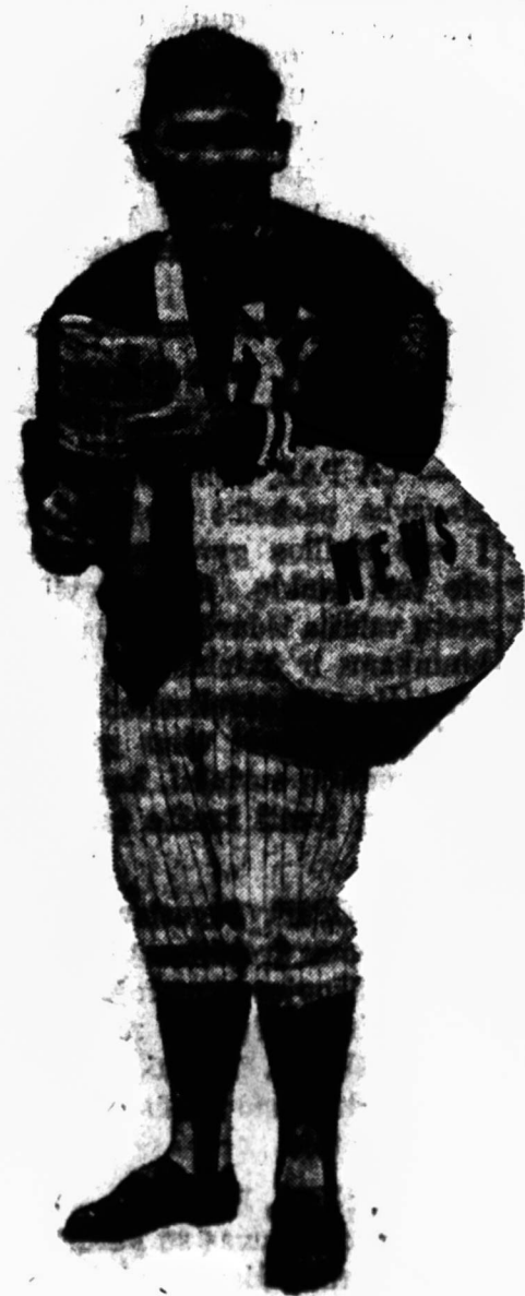
"Everybody should be a newspaper boy," says Yogi Berra

"I was. And I believe it develops traits that will be important whether you're going to be a ball player or a corporation president. It teaches dependability, for one thing. I know it isn't easy to get those papers around when the weather's mean, but those kids do it. (Trying to hit 30 or 40 front porches every day with folded papers never hurt any kid's pitching arm, either.)" "Being a newspaper boy teaches you to be a good businessman too. You learn how to handle money and to save some—do so many of these boys do by buying U. S. Savings Bonds regularly. This dollars they save in Bonds might help get them through college someday. Right now, they help Uncle Sam keep our country strong. I'm proud to have been a news- paper boy. It's a big job."