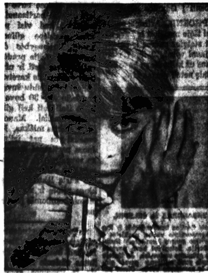
Pats naujienų laikrodininkas paverkti emocijoms atėjus. Gra- žios akis turinti pats budo piktinantis, kad laikrodininkai dar gražesni.

Keep freedom in your future with U. S. SAVINGS BONDS The U. S. Government does not put its name on the bonds. Buy them from the U. S. Savings Bonds Office in your community or from the U. S. Savings Bonds Office in Chicago, Illinois. NAUJINIŲ 1739 So. Halsted Street Chicago 8, Illinois