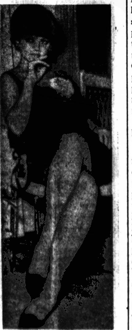
Italė dainininkė Claudia Cardinale atskrido į Londoną dainuoti operoje "Il Trovatore". Pabėgus dainuoti ji pasivėlė po didmiesčio įvairausi kulinarij darymą pėrti. Viešo nek pripažirko, kad ir gėrėtėi sunku.