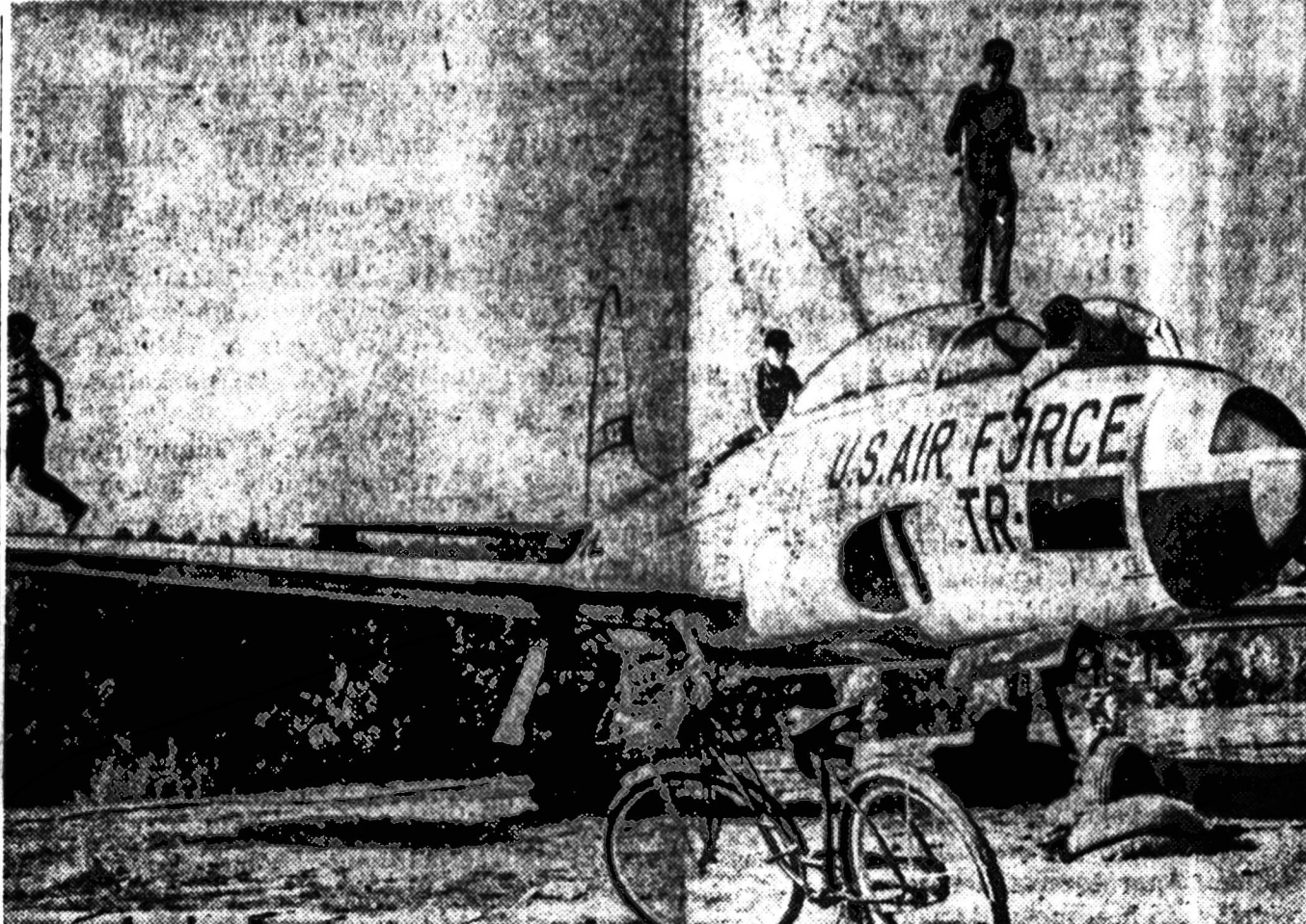
JAV karo vadovybė nutarė atiduoti Zweibrücken kaimelio gyventojams seną ir jau skridimams netinkamą sprausminį lėktuvą. Amerikos aviacijos bazė buvo kaimelio šukuose, lėktuvai gyventojus nerūpino, todėl vieną jiems ir atidavė. Gyventojai nutarė seną lėktuvą pastatyti kaimelio aikštelėje. Paveikslas matome Zweibruckeno vaikų, laipiojančius dovanotą lėktuvui sparnais ir viršumi.