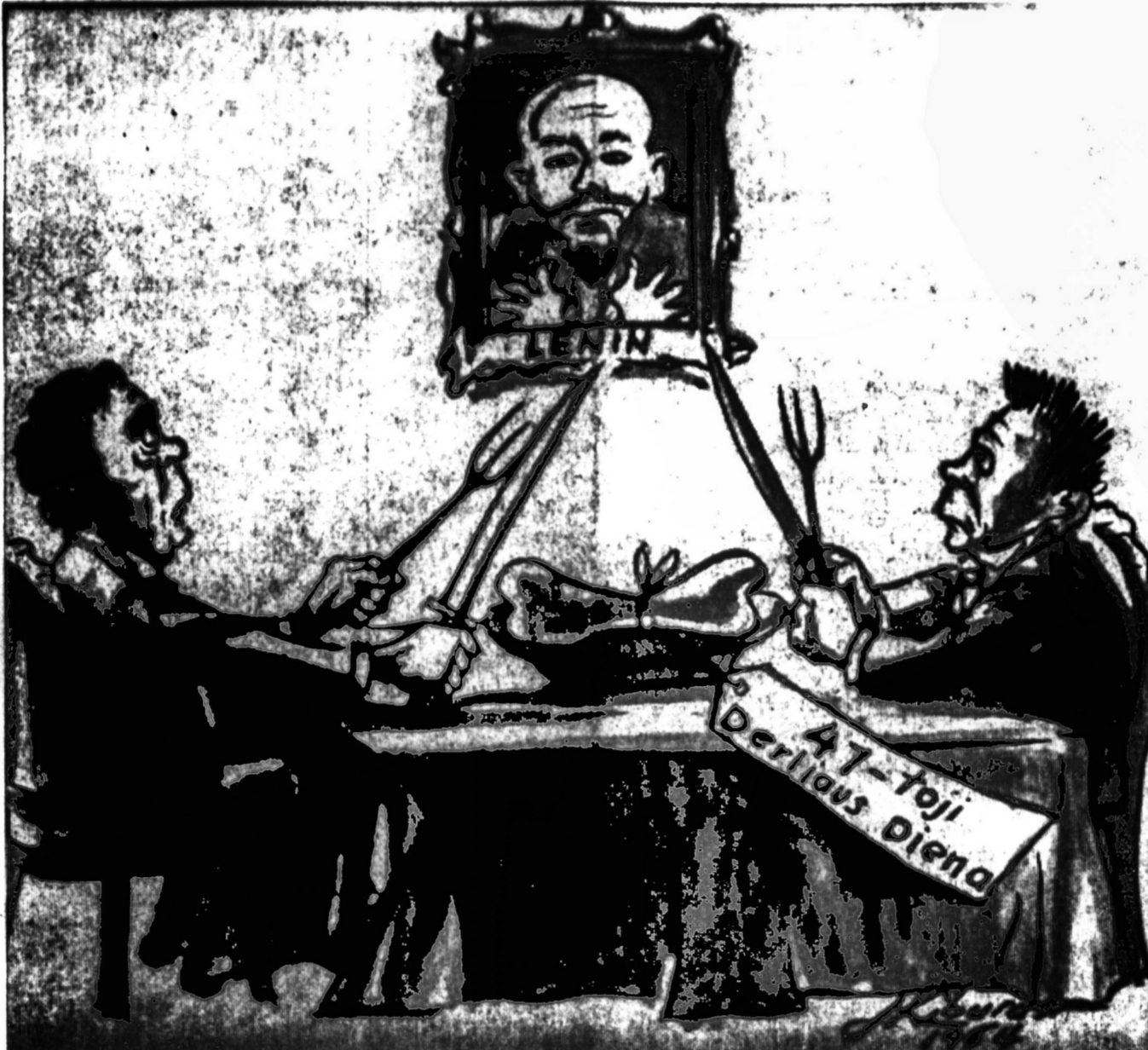
— Visi, net senovės graikai, Derliaus Dieną ant stalo turėdavo įvairios mėsos, duonos ir kitokio maisto, kodėl pas mus tikėtai apgraužtas kaulas? — Brežnevas užklausk Kosyginą. — Kol mes garbinsime panašius tipus, tai kitaip nebus, — atsakė Kosyginas, peiliu nurodydamas į Leniną.

KARACHI. — Pakistano prezidento rinkimuose yra ištatyti septyni kandidatai. Prezidentas bus renkamas kovo mėnesį. Jį rinks 80,000 jau išrinktų elektorių. Svarbiausi kandidatai yra dabartinis prezidentas Ayub Khan ir moteris Fatima Jinnah.