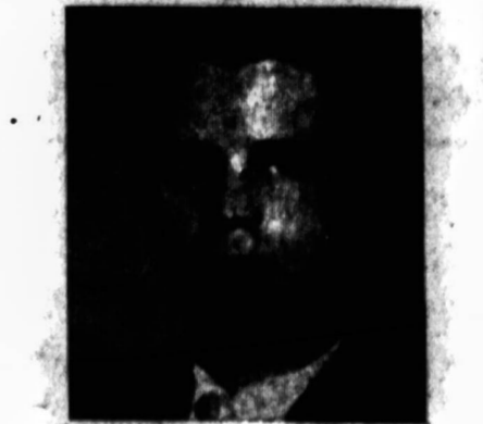
DIMITRIJUS S. POLIANSKIS. Prisdėjęs prie suokabio Nikitai nurodė. Jis eina tikrai 47-ius metus, bet jau paskirtas kompartijos prezidentu. Polianskis yra glaudus vienas reikalų ministro Podgorny bendradarbis. Jis yra ne paprastas ministras, bet ministro pirmininko pavaduotojas. Mūsų belaisvas nori sukli pramjere Kosyginu veikti, todėl Polianskis ir paskyrė pavaduotoju pareigoms.

♦ Darbo sekretorius Wirtz, kuris bando priversti susitarimo tarp geležinkelio bendrovės ir trijų streiku grąšinančių darbininkų unijų, pareiškė, kad dabar vos tik 10 centų per valandą skiria abi besiginčyjančios pusės. Jis tikisi, kad ši maža suma neprives prie streiko.