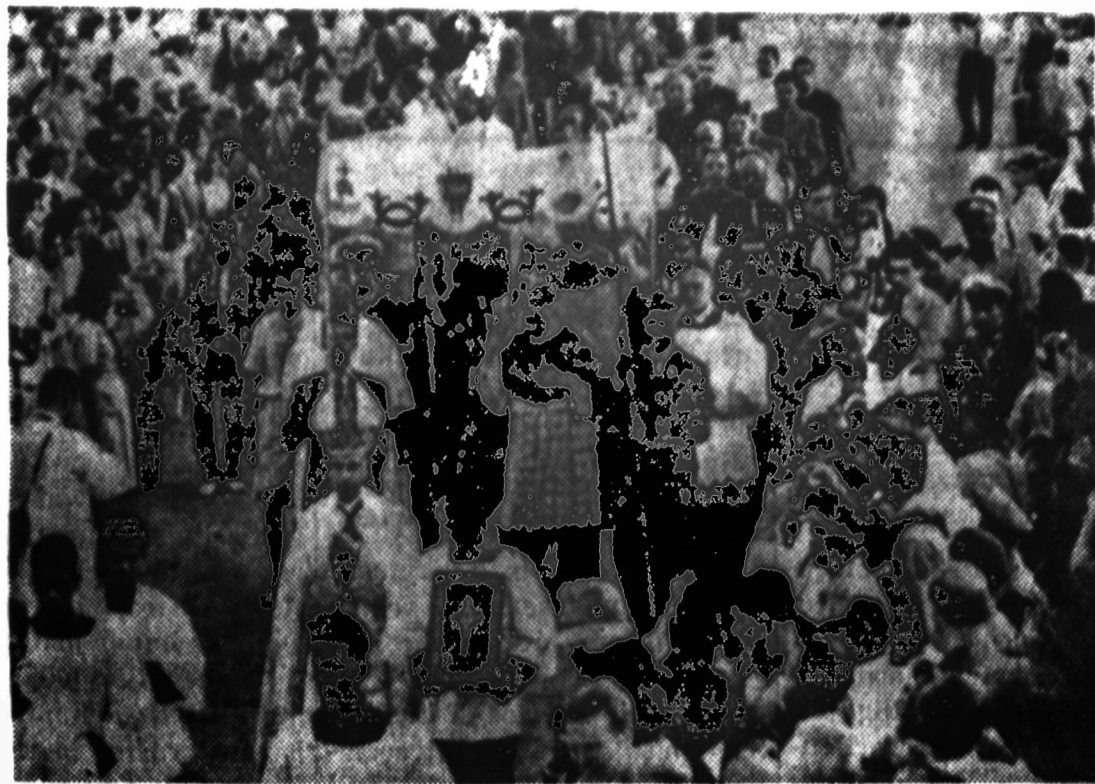
Popiežiaus atstovas kardinolas Agagianian atvyko į Bombėjų, kad galėtų prižiūrėti pasirošimus pačiam popiežiui priimti. Popiežius Paulius VI nutarė keturias dienas praleisti Bombėjuje. Vietinė tikybė sekta protestavo prieš popiežiaus atvykimą. Vietos policija suėmė didok skaičių galimų protestantų, kad popiežiaus vizitas nebūtų sutrukdytas.