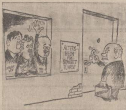
Vokiškas "Frankfurter Zeitung" įdėjo senelių prieglaudos karikatūrą, kurioje jau buvo uždaryti Malenkovas, Molotovas ir Kaganovičius. Pamatę artėjantį Nikitą, uždarytieji per langą pradėjo šaukti: