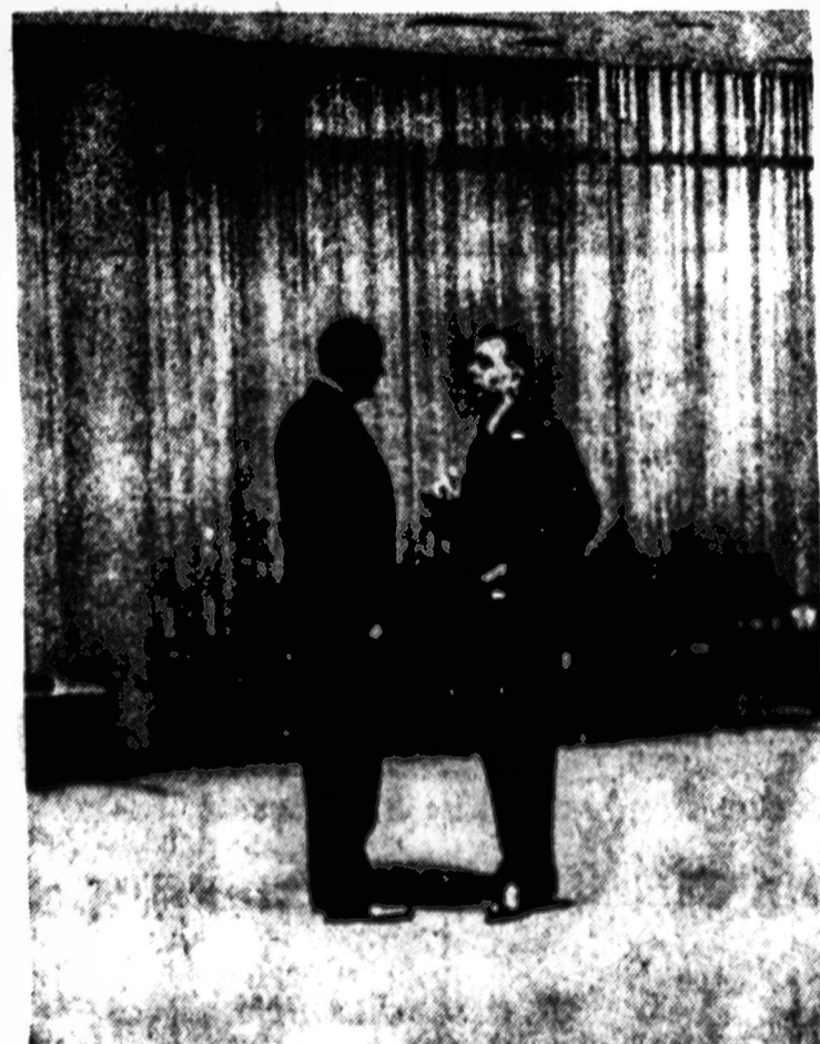
JAV sekretorius Dean Rusk tris kartus kalbėjosi su sovietų užsienio ministru Andrei Gromyko sovietų šalyje reikalų. Sovietų Sąjungoje skolinga Jungtinėms Tautoms 52 milijonus dolerių, bet negali ir nenori šių pinigų mokėti.

LEOPOLDVILLE, Kongo. — Vyriausybės kariuomenė šeštadienį užėmė sukilėlių iki šiol laikomą Stanleyville miesto dalį, esančią kitoje Kongo upės pusėje. Tūkstantis sukilėlių karių pasidavė Tshombės kariuomenei be kovos.