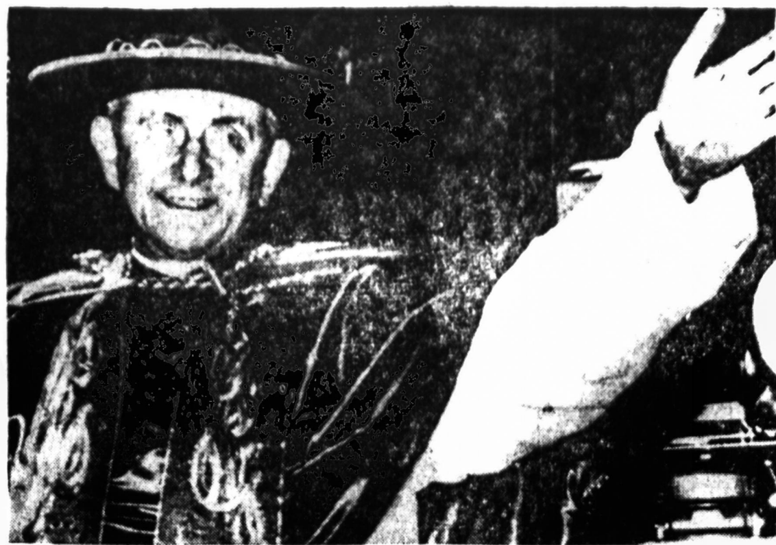
Praeitais šeštadienio naktį popiežius Paulius VI grįžo iš Indijos į Romą. Aerodrome jį sutiko tūkstančiai romiečių ir sveikino už sėkmingai atliktą ilgą kelionę. Paveiksle matome popiežių, iš aerodromo važiuojantį į Vatikano rūmus.