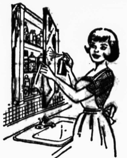
Savo namie vaisty spintelę reikia nepaprastai tvarkingai ir tvarkingai užlaikyti, kaip šiame vaizdelyje parodyta: šimti visos bukutes ir išmągoti lenyvas patikrinti visas užrašus kas neįvyktų klaidų, nes vaisty surašymas gali būti fatališkas, patikrinti, kokių vaisty frakts ir juos papildyti kad būtom bet kokiam netikėtumui pasiruošęs.