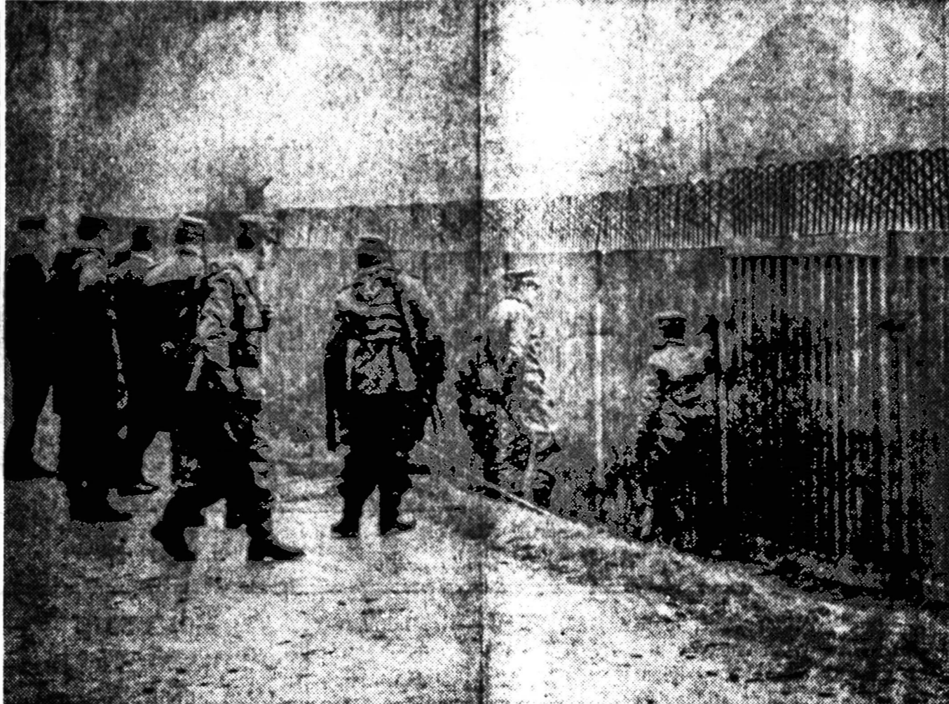
Komunistai nepatenkinti Berlyno siena. Rytų Vokietijos valdžia įsakė nieko neveikiančios kariuomenės vyrams statyti sieną per visą Vokietiją. Paveiksle matoma karių, statančius tvorą Moedlaruth kaimo viduryje.

— BERKELEY, Calif. — Streikuojančio universiteto prezidentas pažadėjo studentams atleisti visas kaltes ir kvietė juos baigti jau du mėnesius trunkančią netvarką. Streikuojančių studentų policija suėmė 590, be jų buvo suimta 185 pašaliniai asmenys, kurstę studentus.