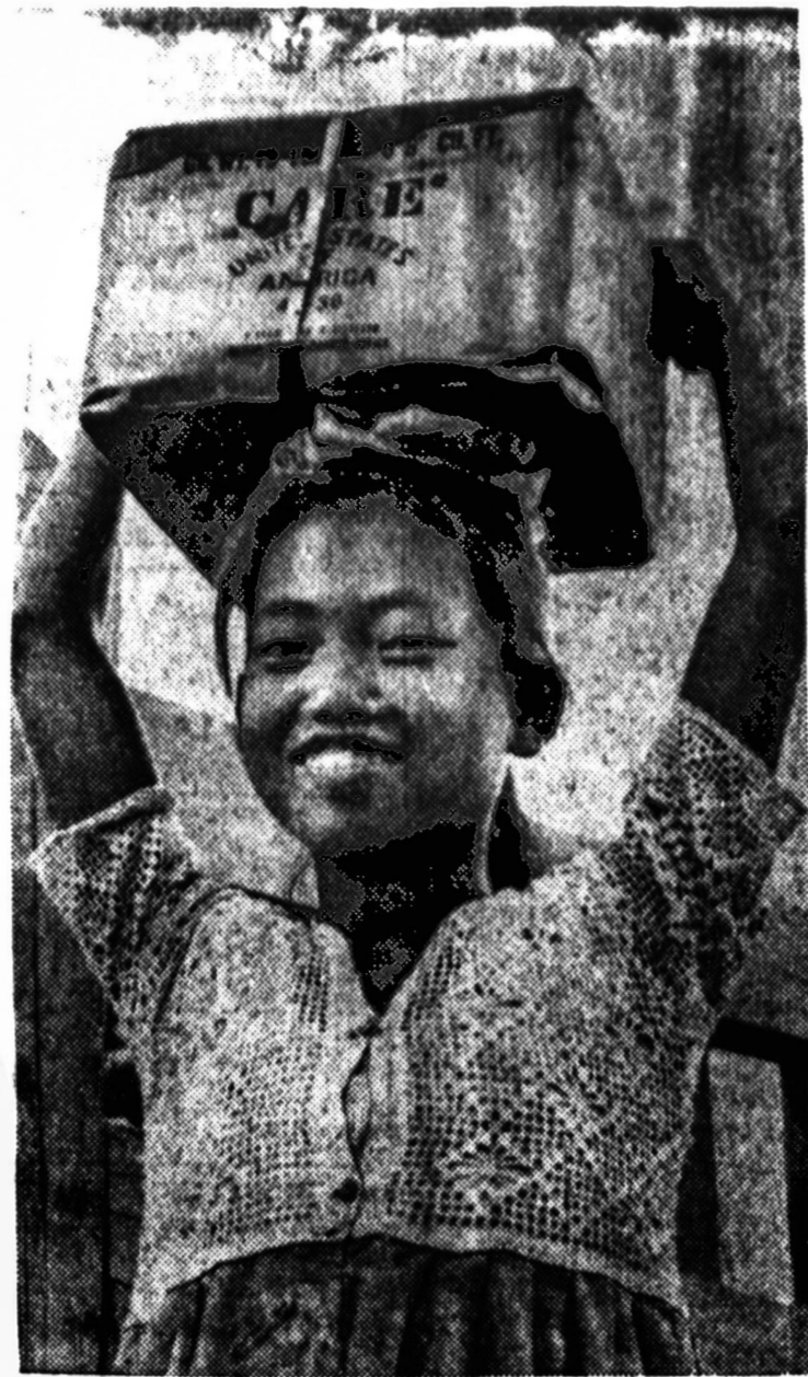
Šiai Korėjos mergaitei Kalėdos bus linksmos. Ji gavo didelį Care siuntinį, kuris atneš daug džiaugsmo ne vien jai, bet ir visai šeimai. Care nori surinkti pusę milijono dolerių, kad galėtų gailai didesnį žmonių skaičių apdalyti siuntinėliais.

DOVANŲ ŠVENTĖMS IR KITOMS PROGOMS didelis pasirinkimas lietuviškų plokštelių. Gintaro, odos ir medžio dirbiniai su lietuviškais vaizdais ir rašomais mašinėms su lietuviškais rašdynais. Aukso, sidabro ir kristalo įvairūs dirbiniai. J. KARVELIS 2715 West 71st Street Chicago, Illinois Tel.: 471-1424