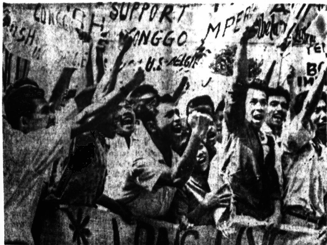
Sukurtyti Indonezijos studentai užpuolė Džakarta mieste veikusią JAV informacijos įstaigą ir su-naikino ketvirtadalį joje buvusių knygu. Jie nuplėšė JAV vėliava ir iškėlė Indonezijos vėliava. Studentai nepatenkinti, kad JAV davė savo lėktuvus baltiesiems Kongo valstybėje gelbėti.