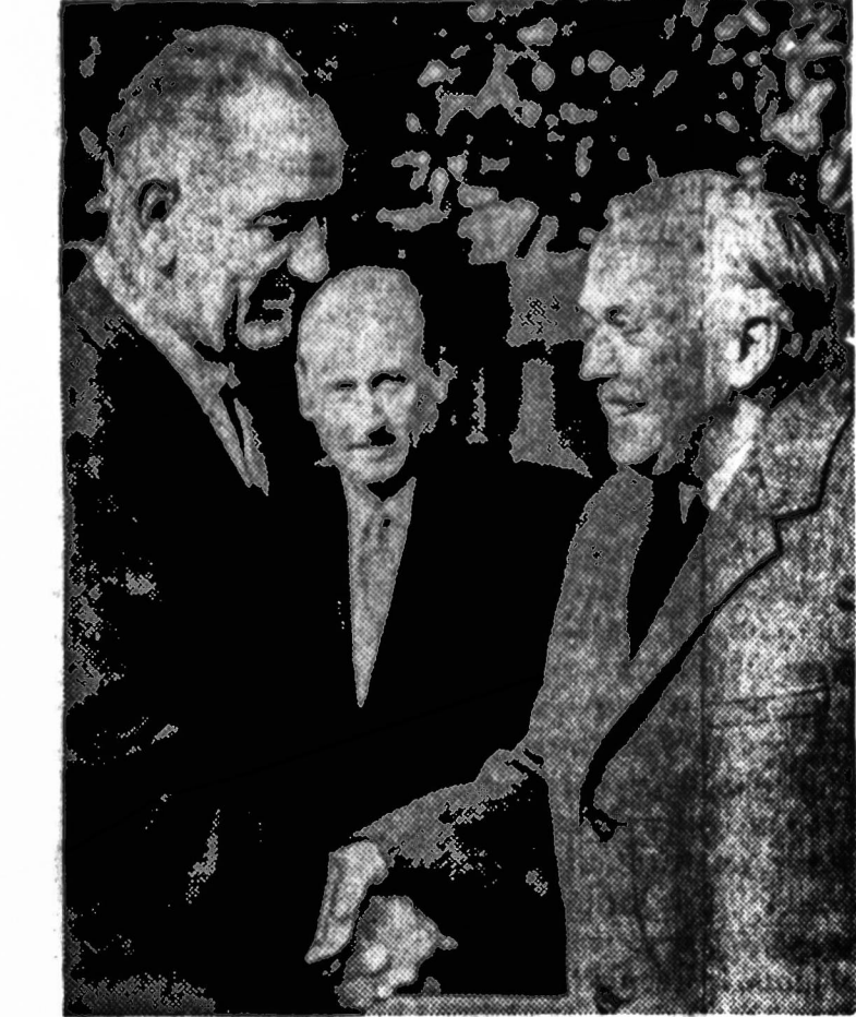
Prezidentas Johnsonas susitiko su britų premjeru Harold Wilsonu ir pradėjo abiejų valstybių pasitarimus užsienio politikai suderinti. Kartu su Wilsonu į Washingtoną atvyko britų užsienio ir karo ministras, gausių patarėjų lydimi.

Kitais metais laivas plaukios tarp Leningrado ir Londono su sustojimais keliuose Baltijos jūros uostuose.