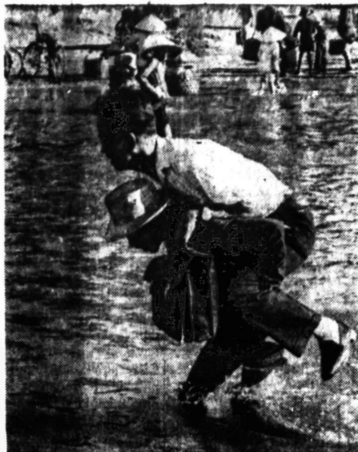
Kai Saigone neveikia pervaža, tai kiti už pusę žmones nešioja ant nugaros. Paveiksle matome nešiką, keliantį kiti už pusę ant darbe skubančių berniukų. Už tokį perkėlimą per upę reikia mokėti 4 centus.

Ne paslaptis, kad abi liuanistinės mokyklos reikalingos paramos, ir kad iš kalėdinio pobūvio jos abi padaro šiek tiek pelno. Bet kokiems galams pobūvis daromas abiejų mokyklų atskirai, kai abiejų mokinius, jų tėvus ir