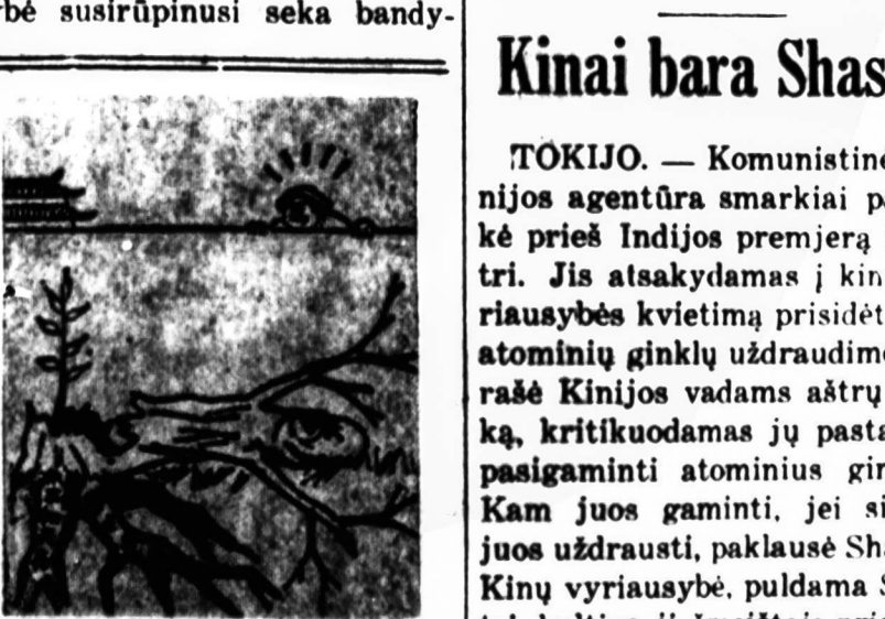
Medis sutrūnijo, nušūdo ir nukrito, bet šaknyje pasiliko, — ralo įspanal. Mao Tse Tungas pastebėjo išsupuvusio kermo išdygusių metų atžalą.

TOKIO. — Komunistinės Kinijos agentūra smarkiai pasisakė prieš Indijos premjerą Shastri. Jis atsakydamas į kinų vyriausybės kvietimą prisidėti prie atominio ginklų uždraudimo, parąšė Kinijos vadams astringą laiką, kritikuodamas jų pastangas pasigaminti atominis ginklus. Kam juos gaminti, jie siūlote juos uždrausti, paklausė Shastri. Kinų vyriausybė, puldama Shastri, kaltina jį šmeižtais prieš kinus. Per tris savaites kinai suskaičiavę net 17 kartų, kada Shastri puolė Kiniją.