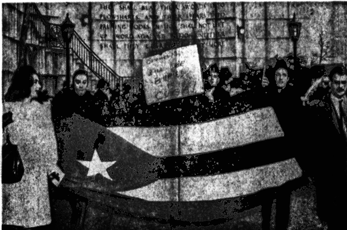
Į New Yorką atvyko Kubos diktatoriaus dešinioji ranka — argentinietis Che Guevara. Jis pasakė kalbą Jungtiniams Tautoms, puidamas JAV. Guevara kalbėjo pozdyje, o lauke New Yorke gyvenantieji kubičiai protestavo prieš leidimą diktatoriui šalininkui kalbėti tarptautinėje orga- nizacijoje.

OTTAWA, Kanada. Parlama- tas balgis svarstyti naujosios Kanados vėliavos projektą. Vy- riausybė nori, kad atėityje Ka- nados vėliava būtų: raudonas klievo lapas ant balto vertikali- nio dugno su dviem raudonom- juostom iš šalių.