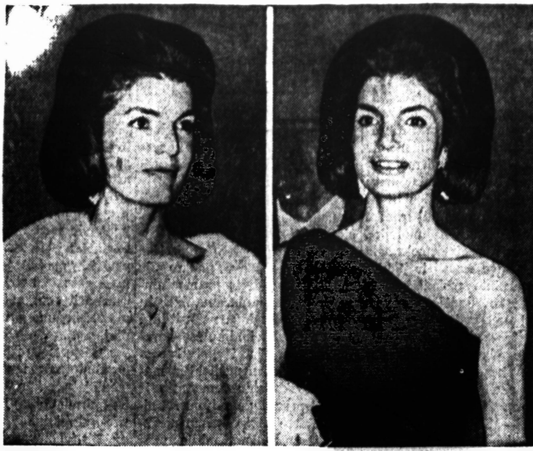
Jaqueline Kennedy dalyvavo Jungtinių Tautų Žmogaus Teisių suruožtame vaidinime. Ji ten buvo nusivedusi abu savo vaikučius. Sūnus John turėjo gardaus juoko, o dukterė visą laiką laikėsi labai rimtai. Ponia Kennedy atvyko užsimetusi baltus kailinukus, o pašalpe teatre sėdėjo juodoj suknieje.

Mažiausiai vienas iš septynių, turinčių širdies ligas, negali gauti medicinos pagalbos, nes neturi išgalių. Triaškinančios sąskaitos už sveikatos pagalbą se-