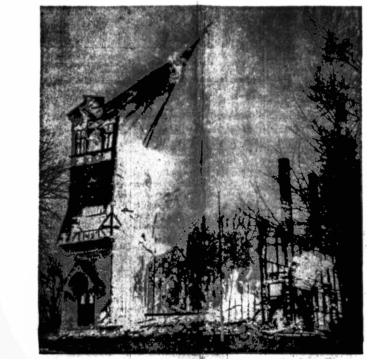
Harvard, Mass., miestelyje stovėjo sena unitarų bažnyčia. Tvirtinama, kad šis medinis pastatas jau turėjo virš šimtą metų. Kilus gaisrui liepos 1 pusvalandį surijo visą maldyklę. Čia matome bažnyčios bokštą, krantinę žemyn.

BONA. — Vakarų Vokietijos prezidentas Luebke priėmė Vokietijoje besilankančią buvusio prezidento Kennedy motiną, Mrs. Joseph Kennedy.