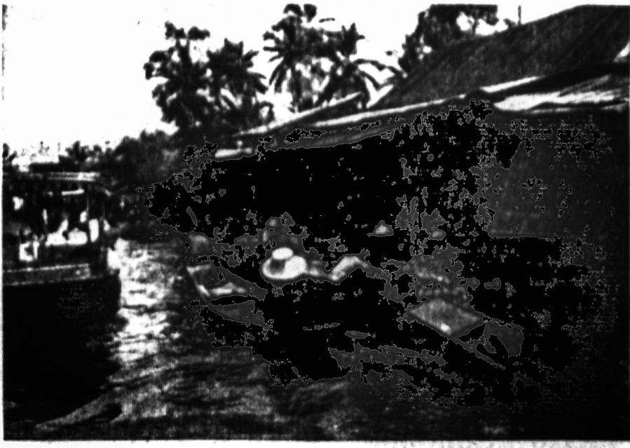
Berodydami Saigoną, turistus viena upė nuvežė truputį toliau už miesto. Paveiksle matome užmiesčio rinką, kurioje balose ir paupiuose gyvenantieji žmonės suveža savo užaugintus ar rastus vaisius, o miestiečiai pirkliai atveža miesto prekių. Čia matome paupįje veikiančią turgų.

MANILA, Filipinų salos. — Prieš išskridamas iš Saigono turėjau progos pasikalbėti su vienu vienuoliu budistu. Tas pasikalbėjimas man paliko rūgštų išpuolį. Tuojau pamaniau, kad jis šių dienų pasaulio nepažįsta. Man atrodo, kad jis ir savo krašto gyvenimo nepažįsta. Gal tokia išvada per greitą, bet pamatysite, kad turiu pagrindo taip galvoti.