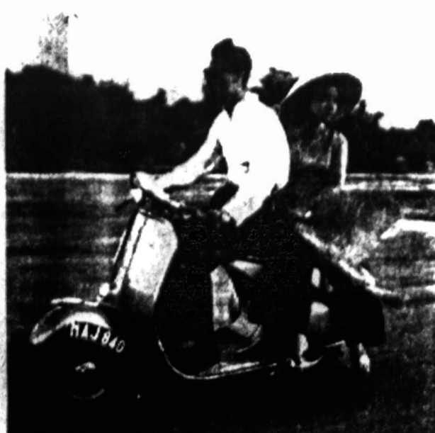
Turtinuosiančių žmonių vaikai arba kariuomenėje tarnaujantieji jaunesnieji karininkai jau važinėja skuteriais. Paveiksle matome tokį jaunuolį, išvežusį užmiestin savo širdies damą. Moterys ten mėgsta didesnes skrybėles, nes saulė smarkiai kaista. Gerokai pašildo ir ilgos saigonių kasos.

— Tai galėjo būti įspėjimas jūsų valdytojui, bet ar krašto priešai supranta tokius įspėjimus? Ar galima daryti tokius įspėjimus saviems, kai priešas prie vartų, kai jis jau į kiemą įsiveržė ir griaua namo pamatus? Kokia prasmė mėtyti