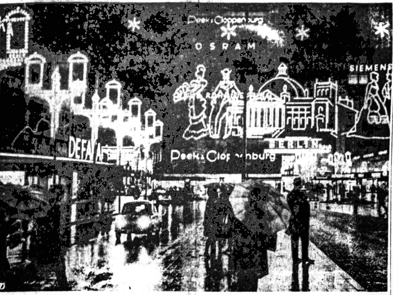
Didieji Vokietijos miestai roriai ateina pagalbon pavergtam Berlynui. Vienas po kito primena gyventojams sušaldytą ir rusišką sieną pervertę Berlyną. Paveiksle matome Essena, kuriame minimas pavergtas Berlynas. Gatvės ir didžiosios krautuvės primena Berlyno gatves ir krautuves.

Prieš išvykdamas Gromyko penktą kartą šį mėnesį susitiko su JAV valstybės sekretoriumi Dean Rusk. Gromyko pareiškė, kad tie pasitarimai nepasiekė jokių išvadų, tačiau jie buvo naudingi.