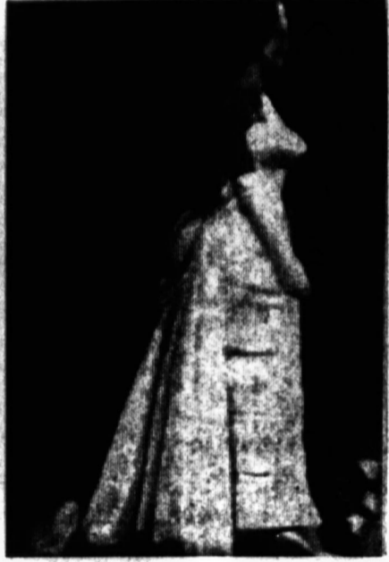
Suvažiavusios gražuolės, prieš pasirodymas teisėjams ir rinkiniui publikai, turi išmokyti, kaip vaikščioti prožektorių šviesoje. Jos turi dėsimis kartų eiti specialiai tiesiais takais, kol išmoka gražiai eiti ir lengvai nusilenkti. Paveikslė matome atvažiusią gražuolę, besimokinančią sirdyti.

Kiekvienų metų vasarą prie Los Angeles, Calif., vyksta pasaulio gražuolių rinkimas. Ir šiemet jame dalyvavau, daug ką mačiau. Galėčiau dienomis puskinti įspūdžius. Deja, kaip niekad iki šiol, neturiu laiko. Vos į metų pabaigą sugriebiau keletą valandų šiam rašinėliui. Iškilmės vyko 1964 rugpjūčio 5-17 dienomis Long Beach, Calif. Tai kurortinis priemiestis, apie 30 mylių nuo Los Angeles.