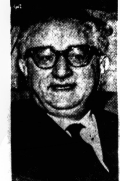
Neapolio advokatas Giovanni Leone kandidavo į Italijos prezidentus. Pirmuose balsavimuose jis gavo daugiau balsų, negu kiti kandidatai, bet nesurinko pakankamo balsų skaičiaus. Debar jo vadovaujama Italijos krikščionių demokratų partija tariasi su kity partijų vadais dėl reikalingo kompromiso.

Pompidou paaikškino, kad Prancūzija neplenuoja turėti bombas tam, kad pasiektų pergalės, ar norėtų karo, bet tik tam, kad gautų saugiai ir taikingai gyventi.