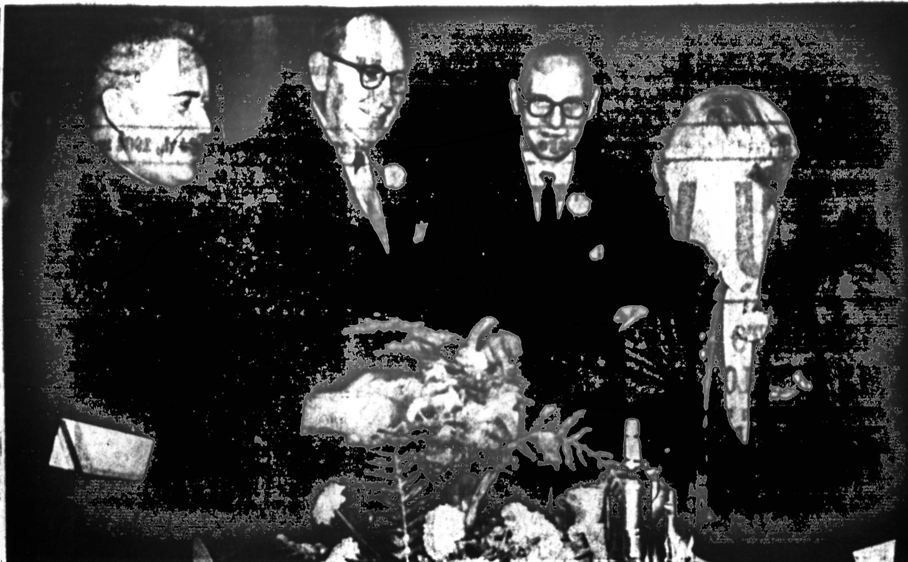
BALTIMORES LIETUVIŲ SVETAINE