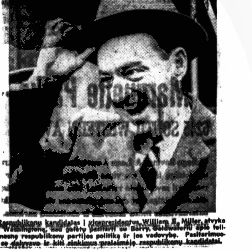
Respublikoni kandidatas ir viceprezidentas William H. Miller atvyko į Vašingtoną, kad būtų pasitarti su Barry Goldwateru apie feil-moing respublikoni partijos politiką ir jos vadovybę. Pasitarimuose dalyvavo ir kiti rinkimus palaikimo respublikoni kandidatai.