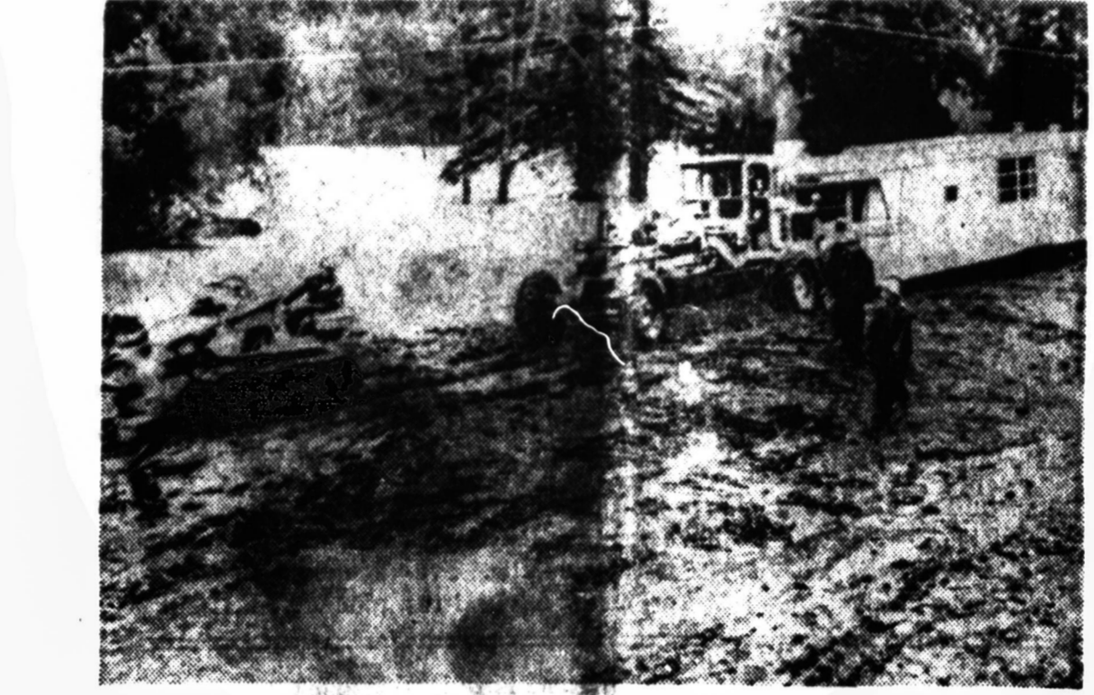
Prasidėjus smarkioms liūpsm, Pacifika pakraujuose vanduo padarė labai didelių nuostolių. Miranda, Cal., srityje išardyti keliai, nugriauti namai paskandinti automobiliai. Matome žmones, paskubomis bėgančius iš pavojingųjų vietų.

Mali respublika. Šiuo atveju reikės balsuoti pilnatis susirinkimui, o tuo atveju, iškilys klausimas ar sovietai turi teisę dalyvauti balsavime. Kitas reikalas, kuris dar daugiau sukomplikuoja padėtį yra tai, kad Prancūzija nuo Naujųjų Metų, irgi, bus skolinga dviejų metų įnašus. Tuo pačiu ir jai reikėtų pritaikinti 19 straipsnį, kuris atima tokiems skolingiems balsavimo teisę. Trumpai tariant, Kalėdų stotogose Jungtinių Tautų nariams, ypač jų sekretoriumi, kuris neseniai išėjo iš ligoninės, kur gydėsi skilvio žaizdas, bus neramos ir pilnos rūpesčių.