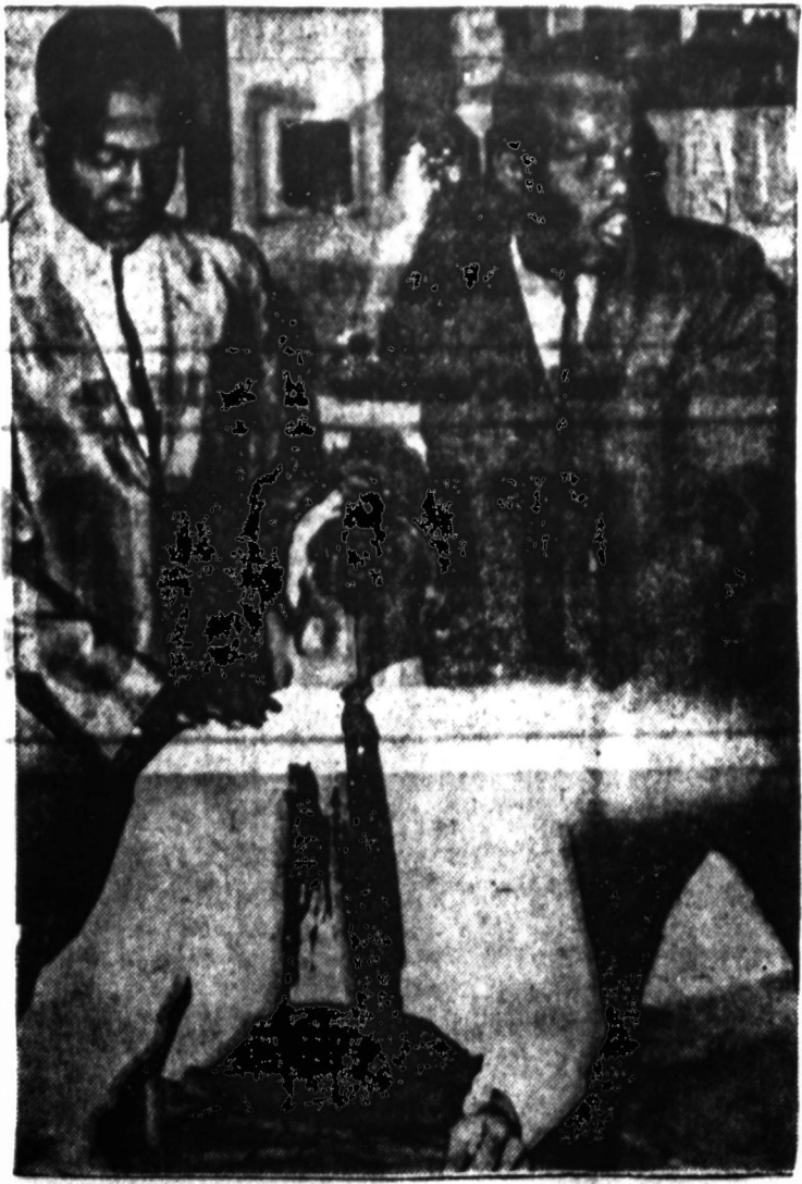
Praktikantė daktarė Hollywood Palladium teatre turėjo parodyti filmą. Tikėtinas mūšio prie 2,000 žmonių. Jie praleidė porą valandų ir tikėtai atgali išėjus. Nėgyvų pinigų, jie prašė duoti teatrą, kad būtų dar. Teatru padarė apie $10,000 nuostolių.

2. Toliau gyd. Carlson gyvenimas mus moko, kad gydytojo