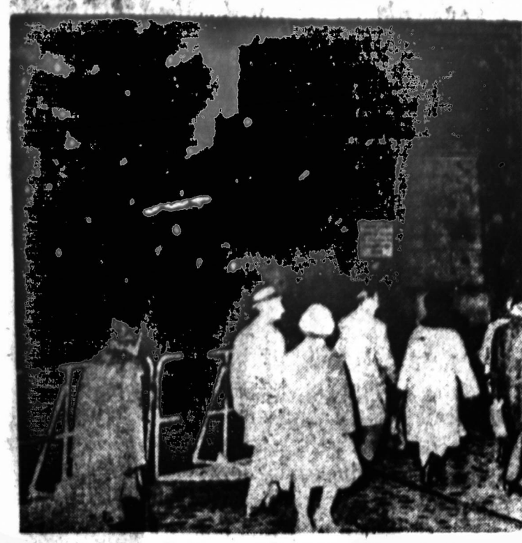
Komunistinė Rytų Berlyno valdžia leido vakarų Berlyno gyventojams aplankyti kitą pusę sienos gyvenančius savo gimines. Pavalksle matoma vokiečius, einančius per Oberbaum tiltą į rytų Berlyną.