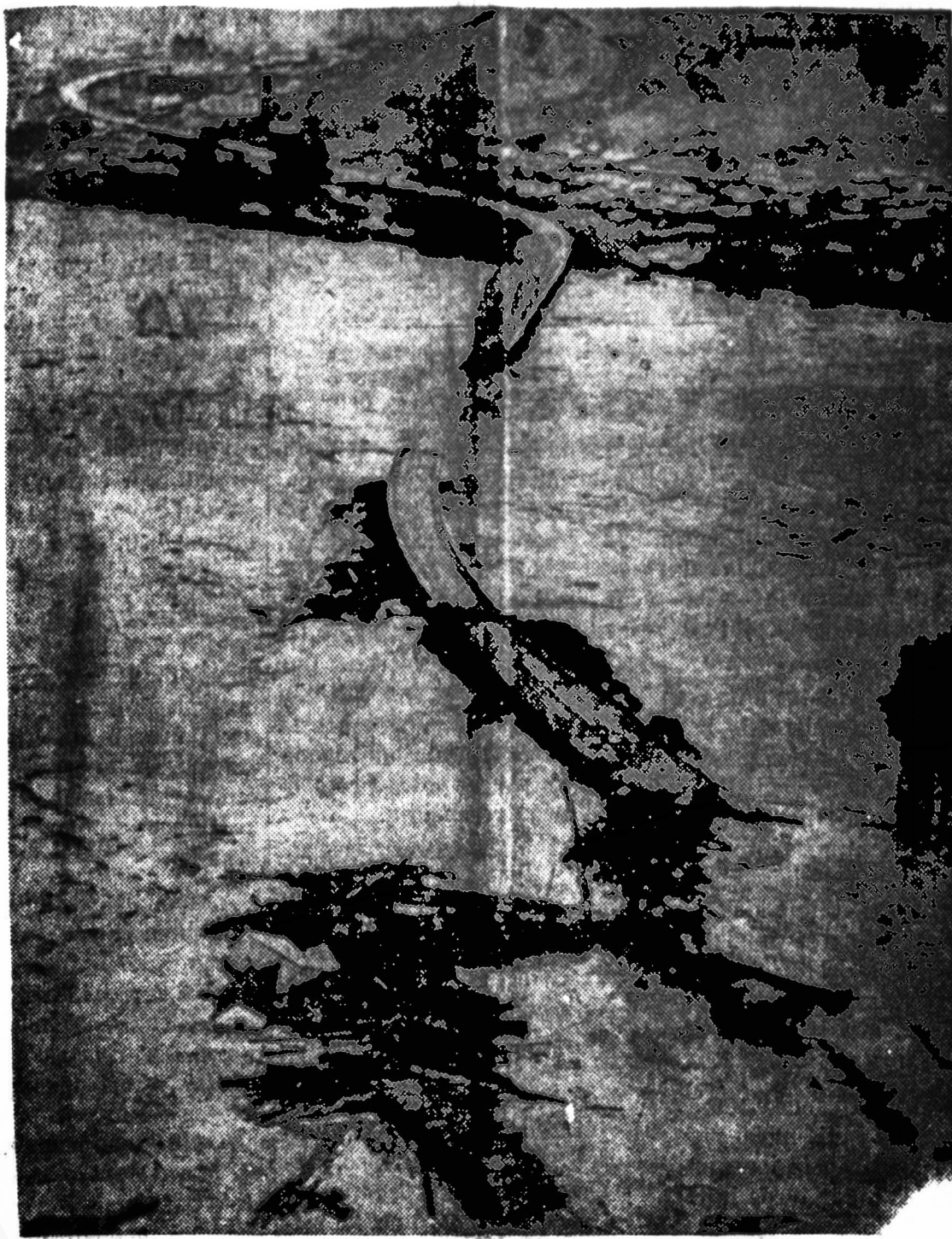
Smarkiai pakilęs Eel upės vanduo išdraskė tiltus ir sustabdė šiaurės Kalifornijos susisiekimą. Pirmon eilien vanduo išvertė stulpus, o vėliau nunešė ir visą tiltą.

KUALA LUMPUR. — Malaizijos vyriausybė paskelbė, kad iš 28 Indonezijos kareivių, kurie išsikėlė į Malaizijos krantą praėjusią savaitę, trys buvo užmušti ir 24 paimti nelaisvėn.