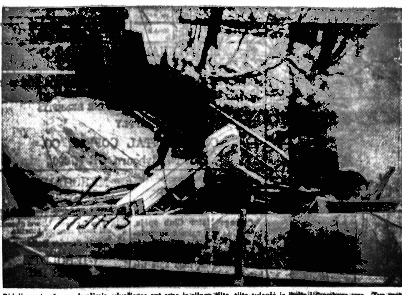
Didelį svorį vežs sunkvežimis, užvažiuojantis ant seno ir silpno tilto, tiltą sulaužė ir įbrito į Čepysų upę. Tuo metu tiltu važiuos dvasininkas taip pat į upę ir prigėrė. Nelsaimė įvyko Ohio valstijoje, Kent miestelio taurose.