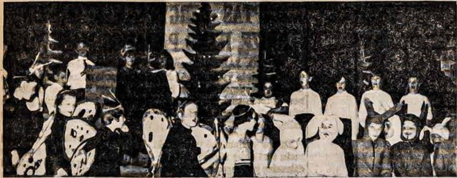
Dalis Detroito Lituanistinės Mokyklos mokinių, 1964 m. gruodžio 20 dieną vaidinusių "Skaidrytę" Lietuvių Namuose.

KONCERTO DIENĄ KASA VEIKS NUO 1 VAL. PO PIETŲ