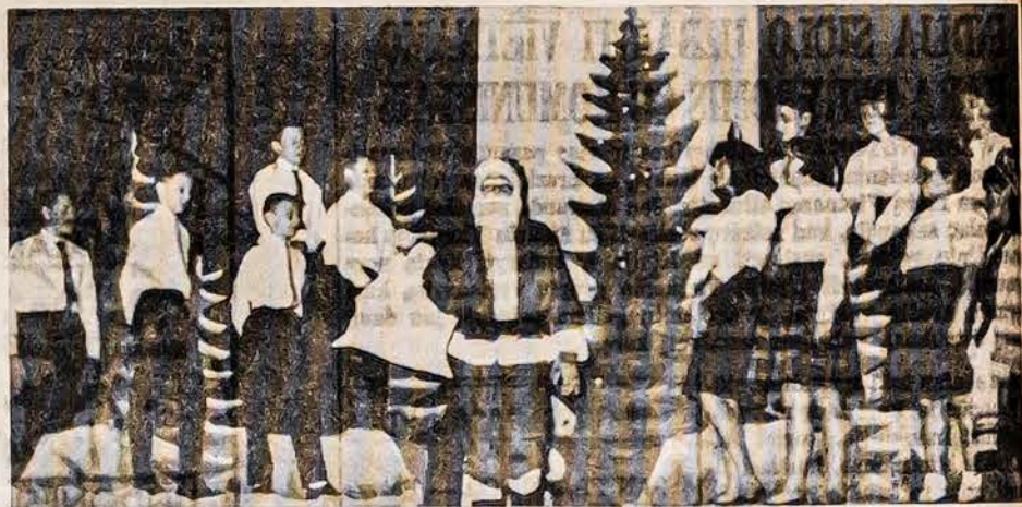
Detroito šeštadieninės Lituanistinės mokyklos mokiniai Lietuvių Namuose pasitinka Kalėdų Senelį 1964 metų gruodžio 20 dieną.