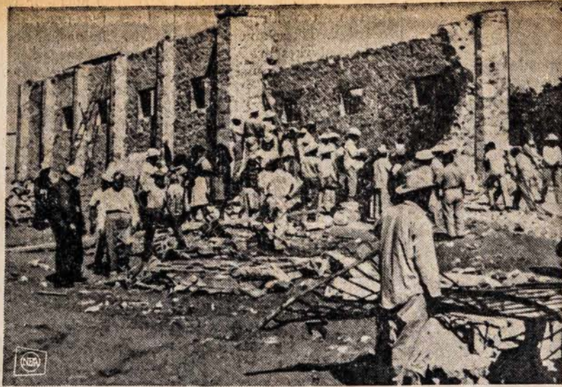
Meksikoje, Rio miestelyje, pamaldy metu krito didelės bažnyčios stogas ir užmušė 71 maldininką. Bažnyčią statė mokyklos nebaigęs inžinierius, bažnyčios klebono brolis. Dabar valstybės gynėjas tyrinėja nelaimės priežastis.

LEO'S SINCLAIR SERVICE Leonas Franckus, Sav. Stabdžiai, sankabos, transmisijos (Standartinės ir Automatinės) ir motorų remontas. — Towing. 5759 So. WESTERN AVE. Tel. PR 8-9533