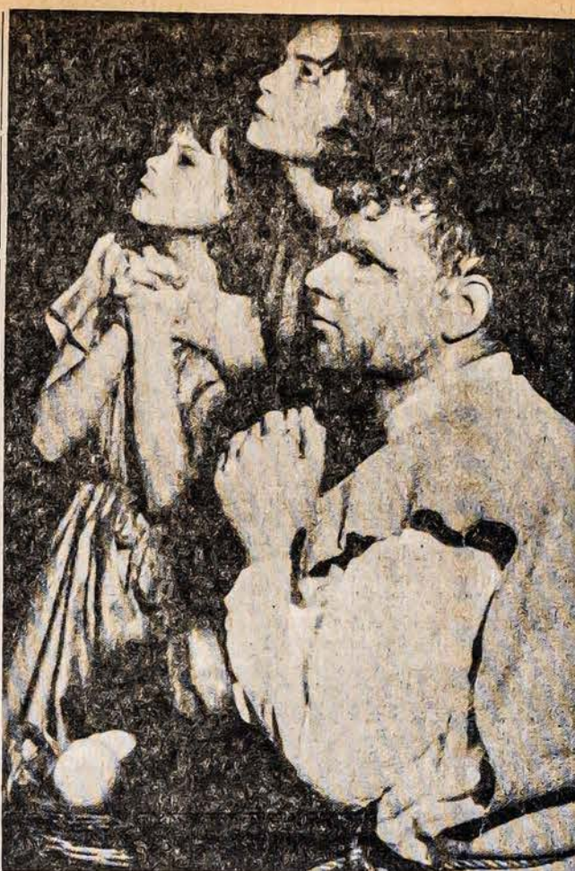
Tremtin patekusių lietuvių šeima Vokietijoje susikaupė Kalėdų metu. Šis paveikslas buvo spausdinamas vokiečių laikraščiuose.

"Lietuvių gimnaziją Huetttenfelde lanko 96 vaikiai... 1954 metais Huetttenfelde įsigytoji piliis yra pasidariusi per maža ir vietoje iki šiol naudotų barakų 1963