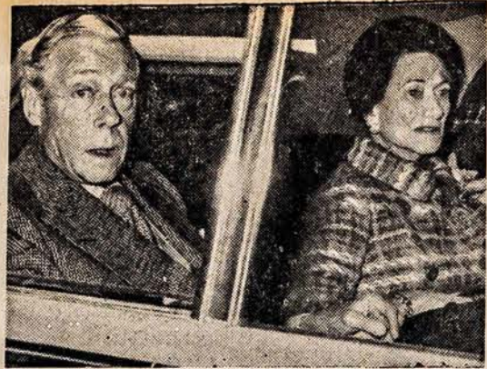
Septyniasdešimt metų sulaukęs Windsorso kunigaikštis buvo sėkmingai operuotas Houston ligoninėje. Jis tiek pasitaisė, kad su savo žmona jau atvažiuo į New Yorką.

Lankytoja iš ligoninės atėjo prie savo automobilio ligoninės aikštėje, 2750 W. 15th Place, ir vos tik atidarė automobilio duris, kai ten anksčiau atsisedęs bandantis atrėmė peilį ir liepė važiuoti į tuščią užgatį, kur nuplėšęs drabužius ir išžaginęs dar atėmė jos su savim turėtus $32. Policija moterį grąžino į tą pačią ligoninę, kur jai buvo suteikta pagalba.