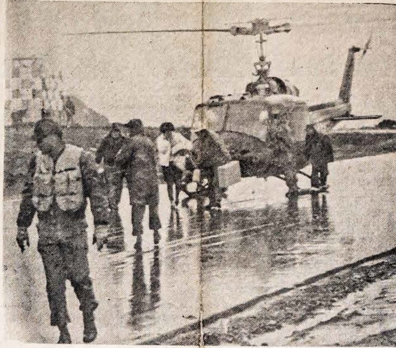
JAV kariuomenės helikopteriais veža maistą šiaurės Kalifornijoje vandens apsemtas sritis. Atskirti gyventojai negauna maisto, neturi pastogės. Paveiksle matome karius, vežančius maistą į Fortuna, Cal., apylinkę.

WASHINGTONAS. — Atstovų rūmų vadai susitarė padidinti kaikiurių komitetų narių skaičių. Padidėjus demokratų atstovų skaičiui reikia proporcingai pakeisti ir komitetų sąstatus. Galingas "ways and means" komitetas, kuris pernai užblokavo "medicare" įstatymo projektą, jau daug metų turėjo 15 narių iš daugumos partijos ir 10 iš mažumos. Dabar susitarta, kad ten bus 17 demokratų ir 8 respublikonai.