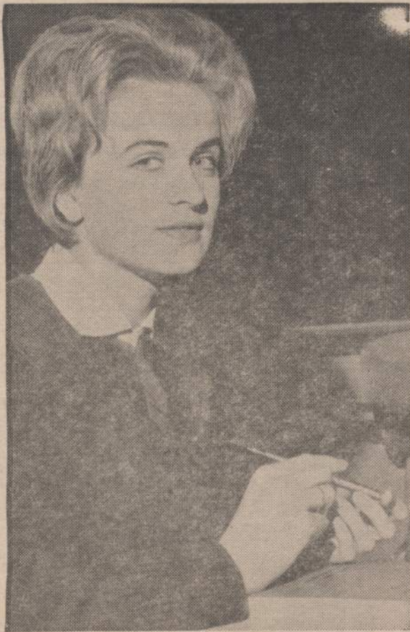
Marina Oswald, policijai padėjusi nustatyti, kad prezidento Kennedy žudikas buvo josios vyras, dabar užsiregistravo Michigano Universitete, kad galėtų pramokti gerai angliskai. Ji turi dvi mažas dukreles.