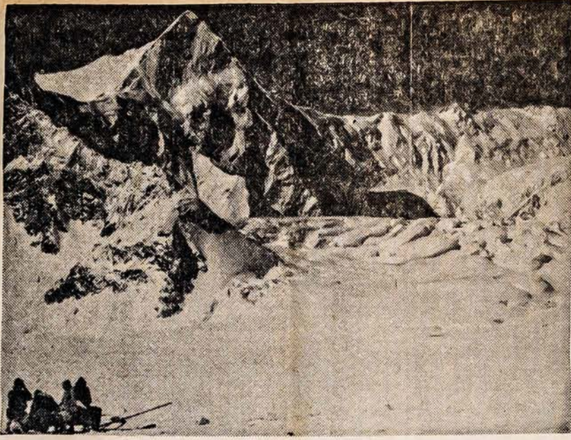
Kanados vyriausybė, norėdama pagerbti tragiškai žuvusį JAV prezidentą, pasienyje stovintį šį kalną pavadino Kennedy kalnu. Kalnas stovi Jukono ir Aliasko pasienyje ir yra 14,000 pėdų aukščio.