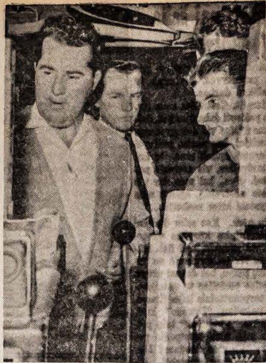
Pačioje Australijoje du jauni vyrai laimėjo $200,000. Jiedu atvyko į Las Vegas ir bandė čia pasipinigauti, bet jų laimė buvo pakirstas kelias. Amerikos biznieriiai, pastebėję, kaip jiedu gražiai valo pinigų, uždraudė jiems vartoti australiškus metodus.