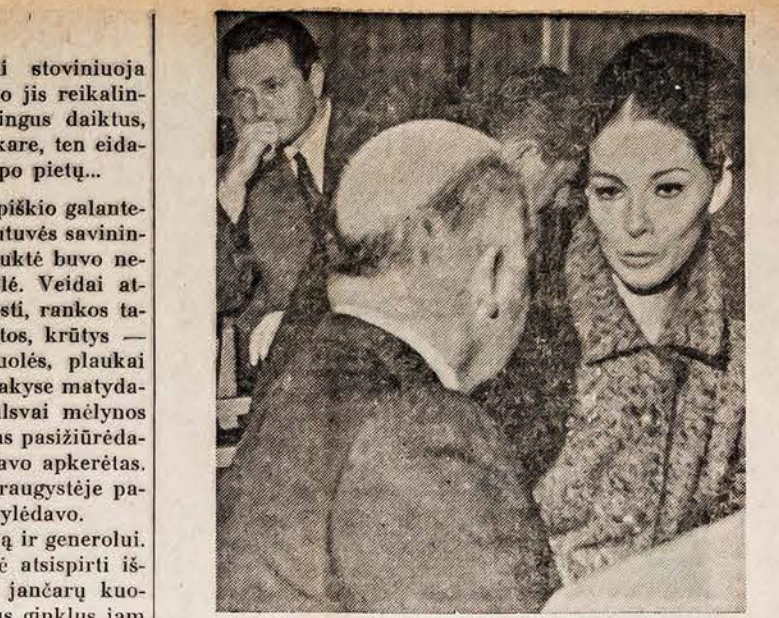
Kino artistė Pier Angeli bylinėjasi su buvusiu savo vyru Vic Damone. Teisme paaiškėjo, kad jis nesumokėjo jai $15,000 mažyčio sūnaus auginimui.