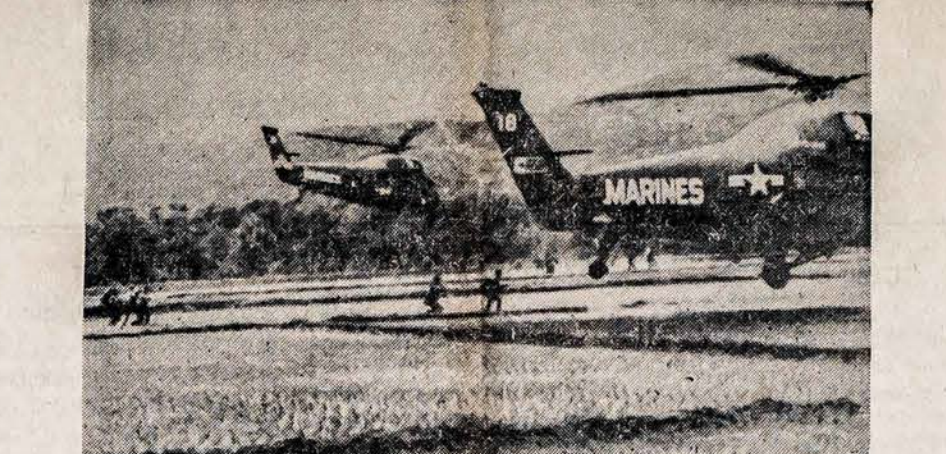
Pietų Vietnamo kariai, nuleisti į ryžių laukus, bėga į pamiškę prieš naikinti. JAV helikopterai sukiniėjasi virš šių karių ir saugo juos nuo komunistų.

JAKARTA, Indonezija. — "Antara" žinių agentūra pranešė, kad Indonezija sėkmingai iššovė savo raketą, susidedančią iš dviejų dalių, į erdvę. Raketos tikslas esąs erdvės tyrinėjimas.