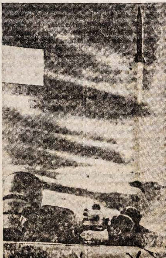
Sovietų armijos laikraštis "Raudonoji Zvaigždė" paskelbė šį raketos paleidimo paveikslą. Sovietų spauda nepaskelbė, kurioje vietoje yra įrengta raketų leidimo vieta.

terų pagrobimu, du buvo ginkluoti medicinos studentų užpuolimai ir vienas daktaro užpuolimas. Iš viso to skaičiaus liko trys banditai buvo suimti.