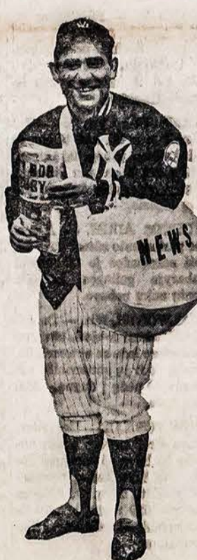
"Everybody should be a newspaper boy," says Yogi Berra

JERUZALĖ. — Dr. Natan Goldmann buvo perrinktas sionistų organizacijos pasaulinio prezidentu. Tuo buvo baigtas 26-asis sionistų kongresas, kurio kalboje prezidentas pareikalavo svarbiausias kongreso būtinutumas yra padidinti stangas-kovoje su žydų nutarimu, su jų susimaišymu ir šalimu. Bus bandoma sustiprinti žydų sąžinę ir ypač kovą gyvintais už žydų jaunimo kilmą.