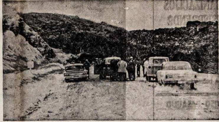
Britų Kolumbijoje ant Hope - Princeton vieškelio nusmuko didokas kalno pakraštys, nutraukdamas susisiekimą. Žemė užvertė keturis kelioveivus.

★ Mielai Tėvai, didžiausi Jūsų bičiuliai ir talkininkai yra skautėjų ir skautėjų vadovai, vadovės. Jie ir jos atduoda nesuskaitomas savo poilsio valandas ir, daugeliu atvejų, nemaža asmeniškų lėšų vaikams auklėti. Daugumas tėvų tai supranta ir vertina vadovų ir vadovėlių darbą, visur dalyvauja, leidžia vaikus į liuanistines mokyklas, prunumeruoja skautišką spaudą, perka lietuviškas knygas. Tėvų skautiška veikla klesti ir žavi visus. Bet yra tėvelių, kurie vi-