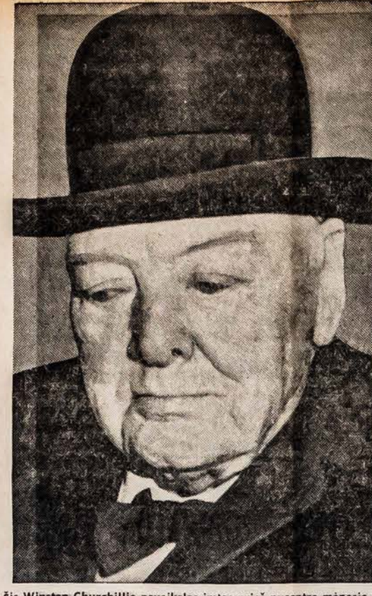
Šis Winston Churchillio paveikslas imtas prieš pusantro mėnesio, kai buvo premjeras rengsi minėti savo 90 metų sukaktį. Sausio 15 dieną buvusį premjerą ištiko labai stiprus širdies priepuolis. Sekmadienio rytą, sausio 24 dieną, Winston Churchillis mirė.