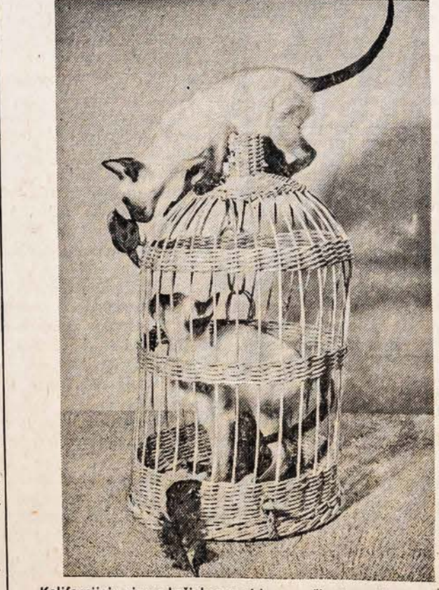
Kalifornijoje vienas kačiukas, norėdamas sučiupti paukštelį, įsibrovė į narvelio vidų, o kitas užlipo ant viršaus. Kai kačiukai pagaliau paukštelį sučiupo, tai pamatė, kad pastangos buvo bergždiškos, nes paukštelis buvo dirbtinis.

A. ABALL ROOFTING Įkurta prieš 50 metų VISOKIUS STOGUS, rinas ir kamuosius vamzdžius sutalsonaujus įdedame. KAMINUS IŠVALOME ir išlaikome. Nudžomos namus iš lauko liekame "tuckpointing" darbus. apdrausti, visas darbas garantuojamas. Skambinkite LA 1-6047 arba RO 2-2470 Įkainavimas veltui, kreipkitės be NAUJIENOSE GALI RAŠYTI KIEKVIENAS TRUŠIUS