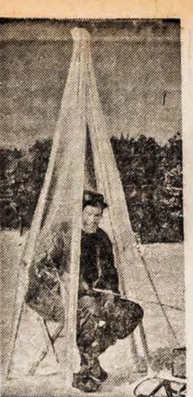
Pati naujausioji žuvavimo būdelė. Ji ne tik apsaugo meškerioją nuo vėjo, bet saulei pradėjus šildyti, šilti spinduliai įeina į vidų ir sušildo meškerioją. Iki šio mėto meškeriojotai vartojo medines arba kartonines būdeles nuo vėjo apsisaugoti.