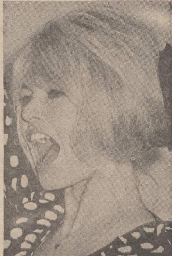
Mėgiamiausioji prancūzų kino artistė Brigitte Bardot atvyko į Meksiką. Spaudos atstovai pradėjo ją klausinėti apie projektuojamus filmus. Kai kurie klausimai erzino artistę, o kiti privertė ją juoktis. Paveiksle matome Brigitą, šūkaujančią laikraštininkams Meksikoje.

Tiesa, moterys jį sekioja. Tačiau tai negali pašalinti jo menkavertiškumo komplekso. Taip