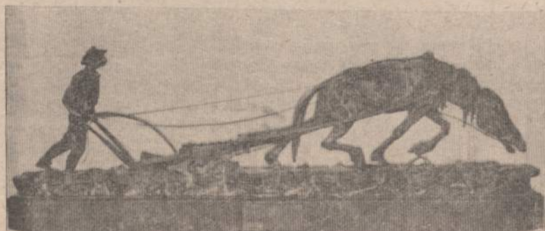
Skulptoriaus PETRO RIMŠOS “Artojas”