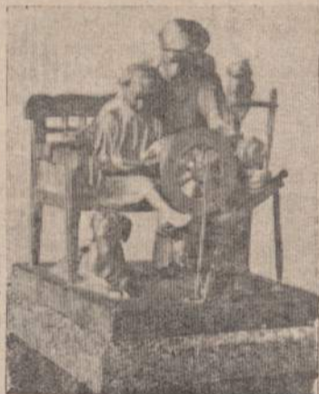
Petras Rimša — “Lietuvos mokykla”