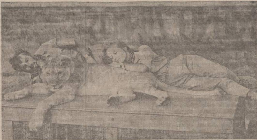
Kenijoje dabar filmuojamas "Laisvi užgimė" filmas. Artistai Bill Travers ir Virginia McKenna pietų pertraukės metu ilsisi kartu su filmoje pasirodantiu liūte.

Vienu laiku jo gyvenime Sinatrai ir pasauliui atrodė, kad ir jis atrado laimę. Tai įvyko tada, kai jis susitiko su Ava Gardner ir tą pačią akimirką pradėjo ją mylėti. Jis užmiršo viską kitą.