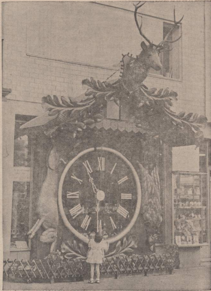
Wiesbadene pastatytas didžiausias vokiečių kukuojantis laikrodis. Paveiksle matome mažą mergaitę, sekancią laikrodžio rodyklių judesius. Kai šis laikrodis "užkukuoja", tai reikia ausis užsikimšti. Jis nepaprastai garsus.