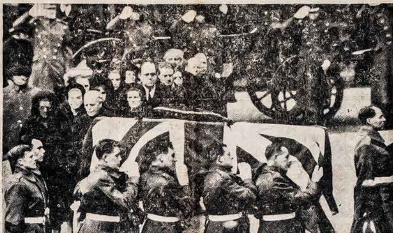
Britų kariai neša Winstono Churchillio karstą prie duobės. Iki kapo velionį atlydėjo tikėtai žmona ir vaikai. Mirusį premjerą valdžios atstovai lydėjo tik iki Tėmės upės.

HONG KONGAS. — Britų spauda iš Hong Kongo praneša apie komunistinės Kinijos planą sustiprinti savo karines pajėgas. Tautinė gynybos tarpyba, kuri buvo sudaryta sausio 8 dieną, nutarė pailginti karo tarnybos laiką visiems kinų naujokams vienais metais. Pėstininkai nuo šiol turės tarnauti keturis metus, kitos ginklų rūšys — penkis metus, o jūrininkai tarnaus šešis metus. Šis karo tarnybos laikas pailginimas duos Kinijai