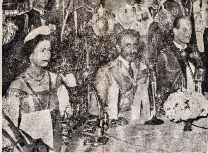
Anglijos karalienė Elzbieta ir princas Pilypas nuskrido į Etiopiją pasisvečiuoti pas imperatrių Haile Selassie. Paveiksle matome imperatorių, sėdintį tarp svečių, atskridusių į Etiopiją trim dienom oficialiam vizitui.

MASKVA. — Prieš pusę metų sovietų spaudoje buvo labai puolamas jaunimo mėgiamas šokis "twist". Jis buvo vadinamas buržuaziniu ir svetimu komunistinei dvasiai. Antradienį "Večiornaja Moskva" rašo, kad "mes nieko prieš neturime prieš twistą, ypač jei jis gražiai šokamas". Kiti naujoviški Amerikos jaunimo šokiai iki Maskvos dar neatkeliavo.