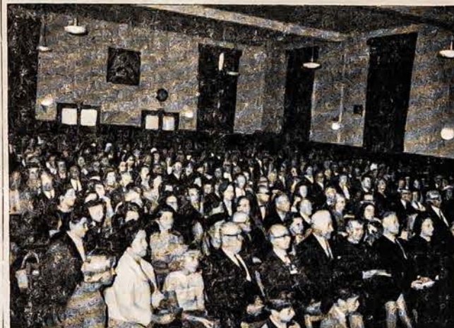
Bendras publikos vaizdas SLA 75 kuopos metiniame parengime.