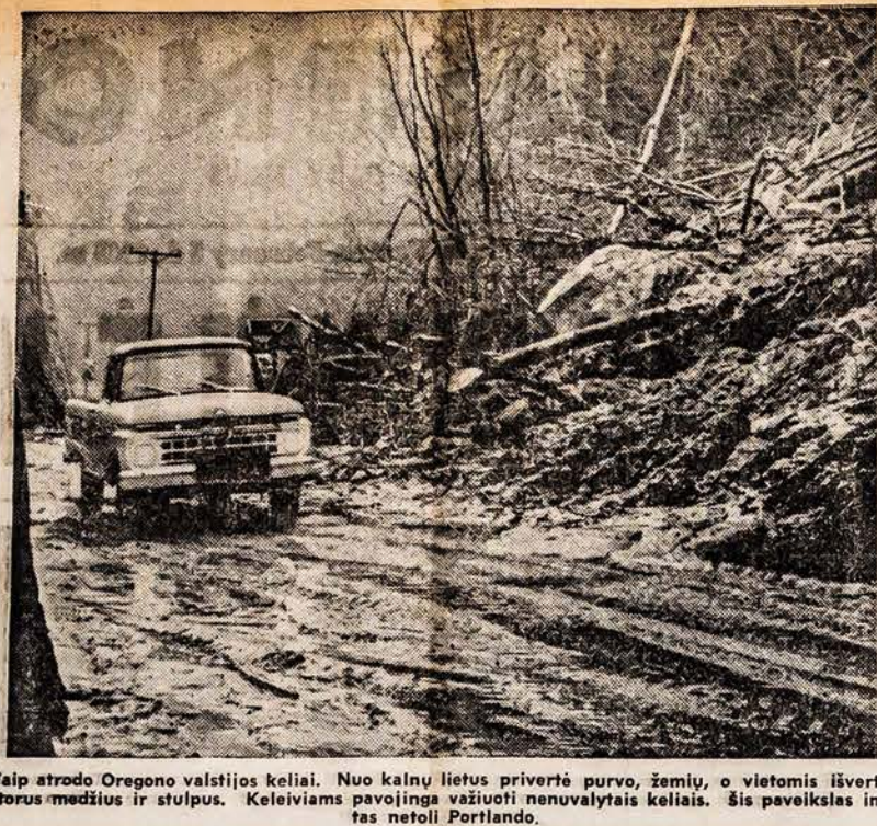
Taip atrodo Oregono valstijos keliai. Nuo kalnų lietus privertė purvo, žemių, o vietomis išvertė istorus medžius ir stulpus. Keleiviams pavojinga važiuoti nenuvalytais keliais. Šis paveikslas imtas netoli Portlando.

2 — NAUJIEŅOS, CHICAGO 8, ILL. — FRIDAY, FEBRUARY 5, 1965