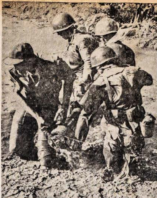
Vietnamo kariams praėitą savaitę pavyko sumušti įsibrovusių partizanų būrį ir atimti iš jų kanuolę. Pavėikite matome karius, velkančius per upelį iš komunistų atimtą kanuolę.

Kaip savi atrodė vaidilos, vai- dilutės. O ta ugnis amžinoji, o tie dūmai, kylą aukštyn. Tas trakšesys aukure, tas sprakšėj- mas, tas liepsnos liežuvių šniokš-