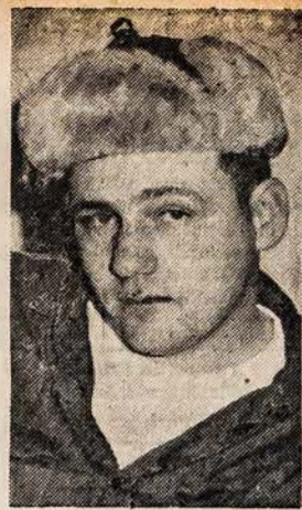
Knoxville, Tenn., miestelyje stude- tai įsitraukė j nepaprastai smarkią sniego gniūžčių kovą. Jie tiek įsima- gino, kad ištraukė iš pravaiziuojančio sunkvežimio šoferį. Jis, besigindamas, paleido j studentus vieną revolverio šūvį, užmušdamas vieną studentą. Da- bar viršuj matomas šoferis traukias- mas teisman už studento nušovimą.

paukštėlis j nelygū sau priešą, savo vaikelius gelbėdamas, kaip iš paskutiniųjų puola gvyulys, gvyvūlis, vis nebebudamas savo gvyvybės. Anava, JAV Tufts uni- versitete yra dramblbio iškamša: dramblinė pamatė, kad ant ge- ležinkelio bėgių stovintj jos vai- ką "puola" traukinys. Metėsi dramblinė ant traukinio, vaiką gelbėdama, ir žuvo.