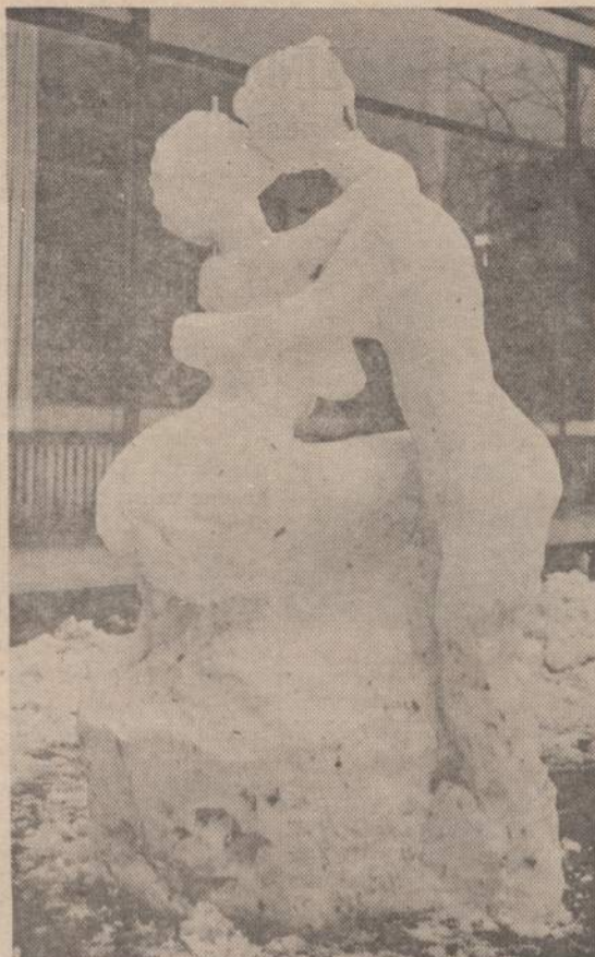
Berlyno menininkas per keturias valandas karnavalo metu iš sniego nulipdė paveikslė matomas figūras. Jis gavo pirmą premiją už gražiai išbaigtą meno darbą.

Anksti rytą, gruodžio mėn. 11 dieną, Gniezno arkivyskupas