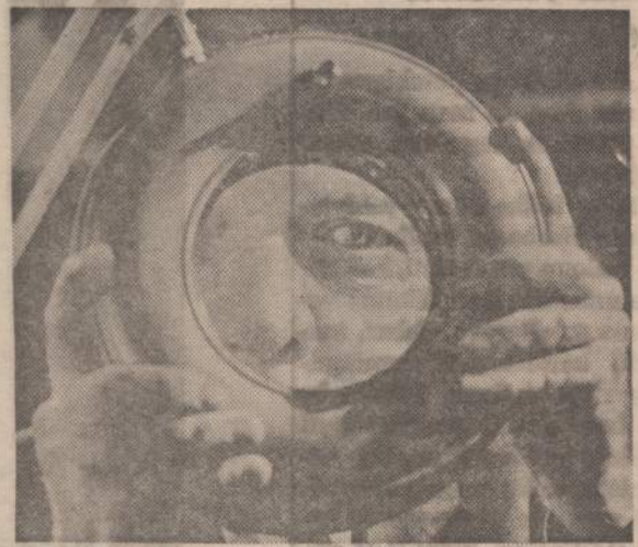
Artistas Van Hefflin žiūri pro padidinamą stiklą, kurį jis turės naudoti naujame filme "Jei kartą buvai vagis"...