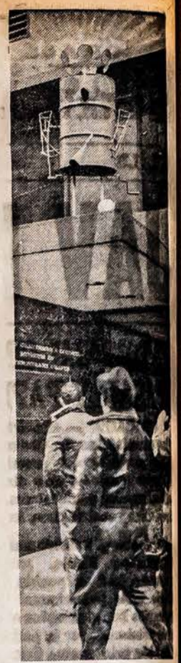
New Yorke nuo aukšto namo nuleidžia didelę skardinę, ligonin prastovėjusią ant stogo ir tarant įvairiems skelbimams.

Teisėjas pareikalavo, kad tarnautojai nustotų davę negrams sunkius registracijos egzaminus ir nesikabinėtų prie formalių, techninių, nesvarbių klaidų ne-