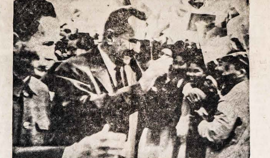
Šiaurės Vietnamo komunistai sveikina atvykusį sovietų premjerą Kosyginą (centre). Kairėje matome šiaurės Vietnamo premjerą Pham Van Dong, sveikinantį sovietų atstovą Hanoi mieste. Kosyginas perskaitė Kremliaus pasidėjimą padėti šiaurės Vietnamui išvyti amerikiečius ir pašalinti karo pavojų pietų Azijoje.

Sovietų Sąjungos ir Kinijos santykių pablogėjimas įvyko netiek dėl skirtingo uždavinijų supratimo ideologinio komunizmo srityje, kiek dėl senų konkurencijos aistrų turtinguose centralinėse Azijos plotuose.