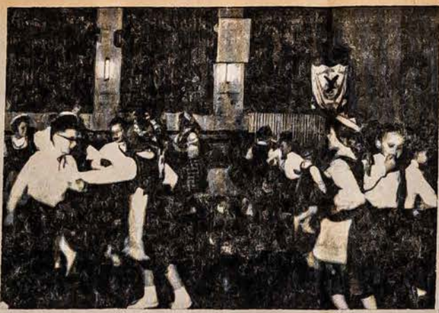
Melrose Parko liuanistinės mokyklos mokiniai išpildo programą, mokyklos Tėvų Komiteto ir vietos LB Apylinkės ruošta, sausio 23 d. mokyklos vakare - baliauje.

Čikagos Aukštesniosios Lietuvinės Mokyklos mokiniai išpildo programą, mokyklos Tėvų Komiteto ir vietos LB Apylinkės ruošta, sausio 23 d. mokyklos vakare - baliauje.