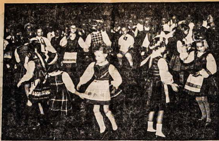
Darius-Girėno Lietuanistikos mokyklos mokiniai šoka vieno pasirodymo metu. Šios mokyklos Tėvų Komitetas su LB Gage Parko Apylinkė ruošia koncertą-balių vasario 13 dieną 7:30 val. vak., Pakšto salėje.