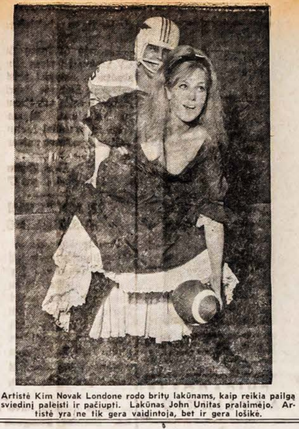
Artistė Kim Novak Londone rodė britu lakūnams, kaip reikia pailgą sviedinį paleistį ir pačiupti. Lakūnas John Unitas pralaimėjo. Artistė yra ne tik gera vaidintoja, bet ir gera lošikė.