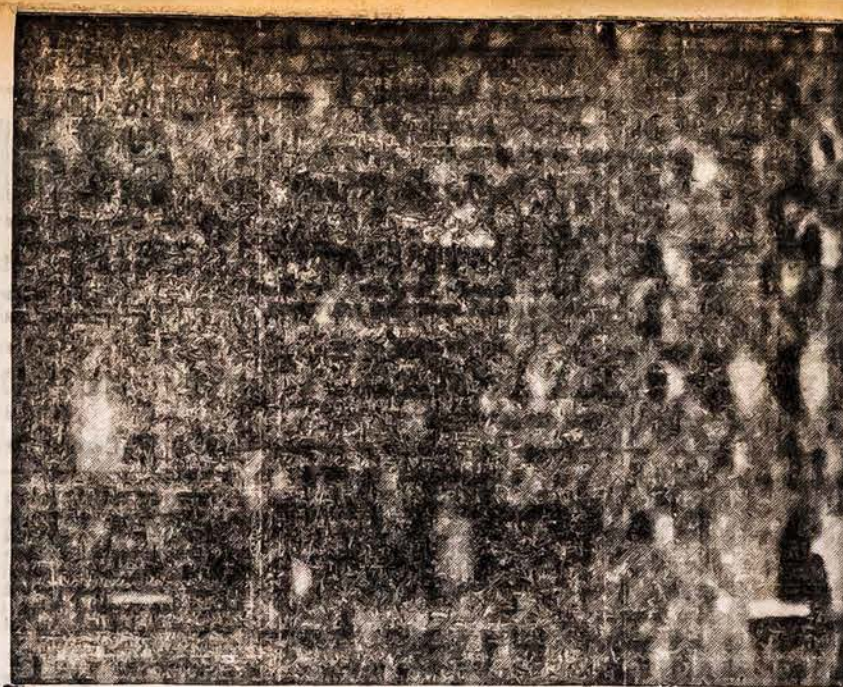
Ranger 8 nutraukė šią foto tikrai pusę sekundės prieš sudužimą. Fotografija imta 2,400 pėdų aukštumoje ir parsijusta į žemę. Fotografija apima 700 kvadratinės menulio paviršiaus pėdas.