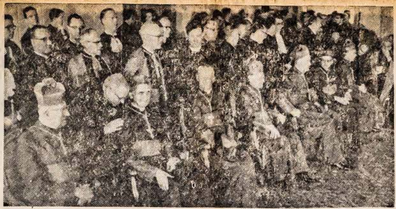
Papiežius Paulius paskyrė septynis naujus kardinolus. Paveiksle matome Amerikiečių kolegijoje susedusius naujus kardinolus, laukiančius oficialaus papiežiaus laiško.