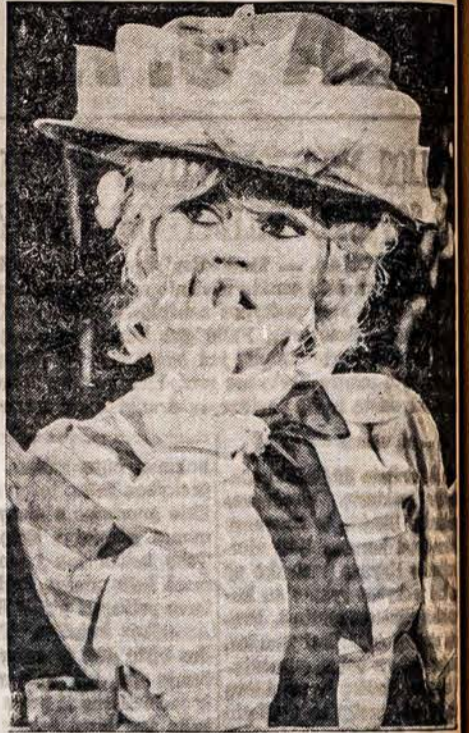
Prancūzų kino artistė Brigita Bardot Meksikoje vaidina komedijos ruošą pagal šio šimtmečio pabaigos gyvenimo įvykius. Artistė redžius šimtmečio pradžioje aukštų damų nešiotais drabužiais skrybėle. Filmas sukamas Meksikoje, Tepezotlan apylinkėse.

Niekuomet neįmanoma visos tiesos pasakyti apie moteris, o jei kuomet ir atrodė galima, nepatartina. (E)