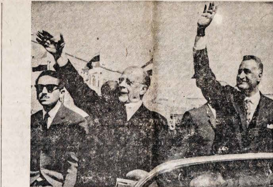
Egipto prezidentas Nasseris ir Rytų Vokietijai rusų primestas komunistas Walter Ulbrichtas važiuoja Egipto gatvėmis. Vakarų Vokietijai nutarė nutraukti visą Egiptui teikiamą paramą, kai Nasseris nutarė oficialiai prilmti Rytų Vokietijos atstovą Ulbrichtą.

Senatorius Thomas Dodd yra atlikęs savo tyrinėjimus apie sovietų produkcijos problemas. Jis prieš kiek laiko rezultatus paskelbė vidaus saugumo komite-