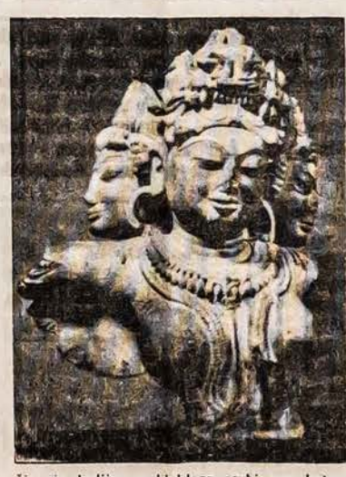
Šiaurės Indijos maldyklose garbinama keturgalvė deivė Kali. Ji viską mato ir viską žino. Jei gerai nusiteikusi, tai viską dovanoja. Bet jeigu užpykusi, tai viską naikina.

500 metų prieš Kristų sanskrito kalba vadinosi grynoji. Gryna ji vadinosi, jeigu ją lyginome su praskritu, negryna gyvenytojų kalba. Bet jeigu ją lygintume su šiaurės Indijos gyventojų kalba, kalbėta tūk-