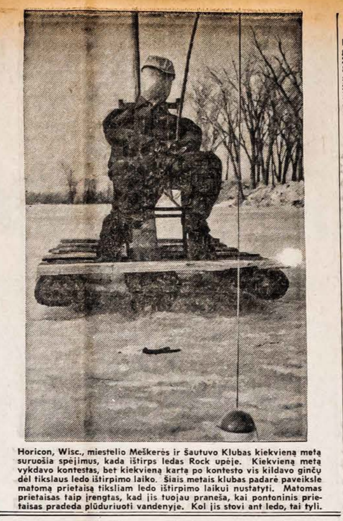
Horicon, Wisc., miestelio Meškeris ir Sautuvo Klubas kiekvieną mėną suruošia spėjimus, kada ištirps ledas Rock upėje. Kiekvieną mėną vykdo kontestas, bet kiekvieną kartą po kontesto vis kildavo ginčų dėl tikslaus ledo ištirpimo laiko. Šiais metais klubas padarė pavykslę matomą prietaisą tiksliam ledo ištirpimo laikui nustatyti. Matomas prietaisas taip įrengtas, kad jis tuojau praneša, kai pontoninis prietaisas pradeda plūduriuoti vandenyje. Kol jis stovi ant ledo, tai tyli.

Pastabėlės Lietuvių kilmės maskolbernius pagavo isterika, kad Vasario 16-os proga laisvasis pasaulis vėl prisiminė pavergtą tėvynę ir jos kovas bei siekius atgauti laisvę. Jie niekaip negali įsivaizduoti lietuvių laisvę. Juk tas pats maskolius virš šimtmečio išlaikė lietuvių priespaudoje. Net gimtąjį žodį buvo uždraudęs. Per kančias, pasišventimą ir kovą lietuviai buvo atgavę laisvę. Tam pačiam maskolui vėl pasisekė užvožti ant Lietuvos dar sunkesnę savo leteną. Tuo maskolberniai labai apsidžiaugė, o čia ir vėl reikalaujama Lietuva laisvės. Jų galvoj netelpa, kaip lietuvis gali būti laisvas ir valdytis pats, be burlioko priespaudos. Dažnai girdime mūsų maskolbernius save vadinant "pažangiaisiais". Kaip kas suka galvas ir negali suprasti, kur jie komunizme mato pažangą, laisvus žmones pavertus vergais ir visą pažangą gražinus bent šimtmečius atgal? Atrodo dėl to "pažangūs", kad jie koja kojoni stengiasi žengti, taikydami į purvino burlioko pėdas. Paskutinėmis dienomis televizijos stebėtojai turėjo progos pamatyti komunistinės kultūros auklėtinius. Matėme išvartas į gatvę minias iškreiptais veidais, išverstom pamišėlių akim, besidraskančius, klykiančius, tiek blogai!