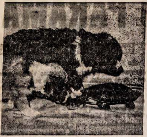
Du šuniukai nusėbo, kai pamatė judančią apverstą lėkštę. Iš apšios iškūjo galvą vežėys, pauostiną šuniukus ir toliau nukeliavo. Vežėlys nekrepė dėmesio į šuniukus.

RENGIAMA ŠIŲ METŲ VASARIO MĖN. 27 DIENĄ (ŠEŠTADIENĮ), 7:00 VAL. VAKARO DARIAUS GIRENO DIDŽIOJOJE SALĖJE, 4416. So. WESTERN AVENUE SU MENO PROGRAMA. GROS A. RAMONIO ORKESTRAS. MAZOSIOS LIETUVOS LIETUVIŲ DRAUGIA