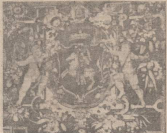
D. L. K. valstybinis herbas - žymuo paskutiniojo Gedimainičio, Zygimanto Augusto, D. L. Kunigaikščio ir Lenkijos karaliaus, kilime - gobelene iš antros XVI šimtmečio pusės. Raitelio - žirgvaikio šarvai šviesaus plieno spalvos. Kryžius — aukso. Caprakas — tamsiai mėlynas. Žirgas - baltas. Didelio skydo dugnas — raudonas. D. kunigaikščio kepurė (kalpokas - mitra) — tamsiai raudona su aukso vainiku, be kryželio. Mitros ir skydo bendras didelis ovalas — šviesiai mėlynas: lyg veidrodis. Viso kilimo dugnas — kaštanų spalvos, kiek muša į rausvumą. Figūros ir ornamentai — gelsvi. Vaisiai naturalios išvaizdos, o lapai — žalsvi.