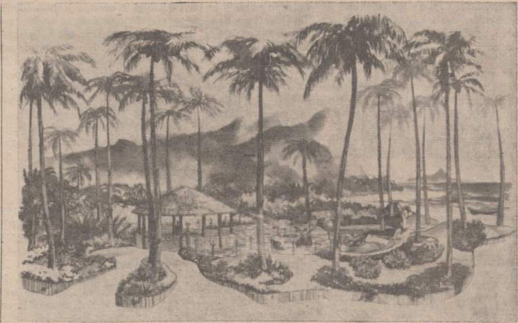
PIETŲ JŪRŲ SALA CHICAGOJE

1958 metais okupantai Lietuvoje išleido lietuvių ir rusų kalbomis stamboką veikalą "Vilniaus Architektūra" iki XX amžiaus pradžios." Prie knygoje sudėtų 206 fotografijų duota paaiškinimai. Kur kalbama apie paminklus, kurie buvo sugriauti ar sužaloti karo metu su rusais, paaiškinimai šalfalsifikuoti nutylint tikruosius faktus. Pavyzdžiui, prie Gedimino pilies fotografijos pridėtas paaiškinimas, kad pilis kaip karinė tvirtovė paskutinį kartą buvusi panaudota 1661 metais. Mūsų metu ji buvusi apgriauta ir po to nebeatstatyta. Bet su kuom tie mūsų ėjo — nutylėta. Vengta pasakyti, kad kunigaikštis Boguslovas Radvila tais metais po trumpos rusų okupacijos vėl atsieniė Vilnių. Žiaurumais pagarsėjęs maskolių komandan-