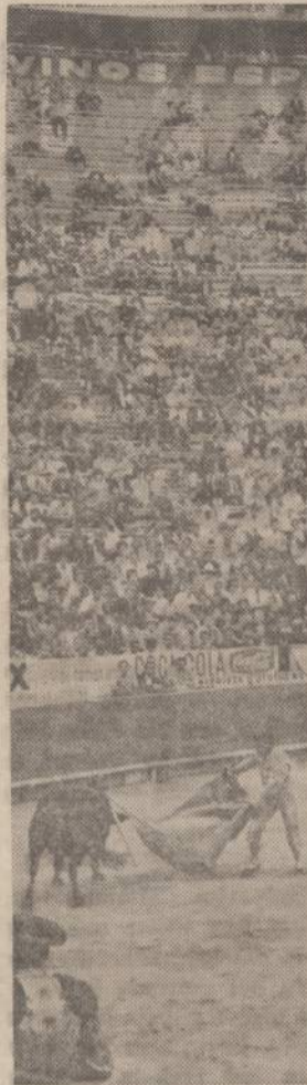
Meksikoje vis dar tebeina rungtynės su buliais. Paveiksle matome mėgėjus, erzinančius bulių. Už pasirodymą arenoje mėgėjai gauna po tūkstantį dolerių, o profesionalai po keliasdešimt tūkstančių.

Tie, kurie stengiasi pabėgti iš savo aplinkumos, dažniausiai nieko gudresnio nepasiekia. Jie