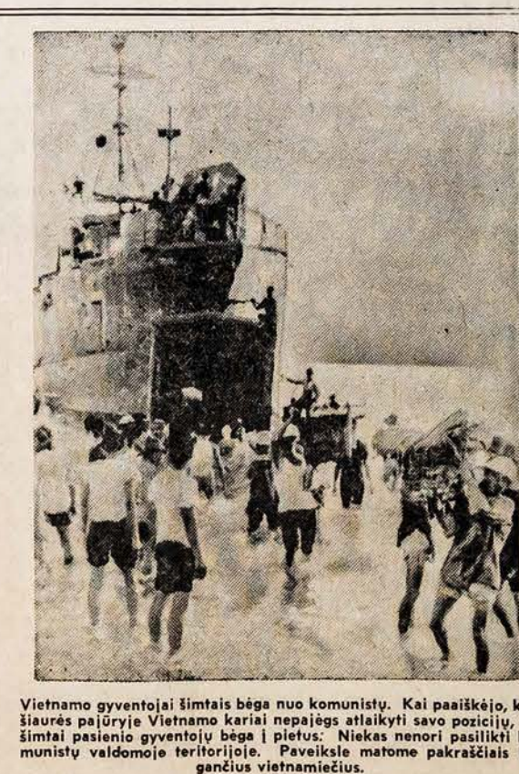
Vietnamo gyventojai šimtais bėga nuo komunistų. Kai paaiškėjo, kad šiaurės pajūryje Vietnamo kariai nepajėgs atlaikyti savo pozicijų, tai šimtai pasienio gyventojų bėga į pietus. Niekas nenori pasilikti komunistų valdomoje teritorijoje. Paveiksle matome pakraščiais bėgančius vietnamiečius.

BOLIVAR. — Venezueloje netikėtai gyvi atsirado du amerikiečiai, kurių lėktuvas nukrito kalnuotoje džiunglių vietovėje. Jie 10 dienų keliavo, kol pasiekė civilizaciją.