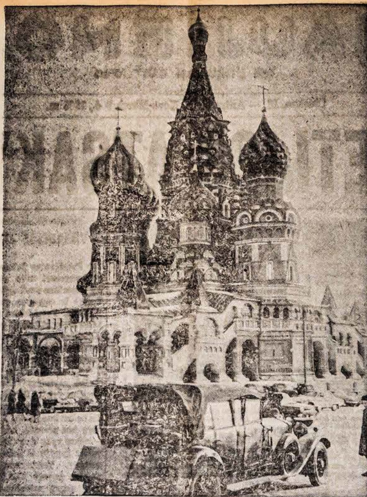
Sovietų valdžia suka Lenino gyvenimo filmą. 1920 metais Leninas važinėjęs čia matomu Rolls-Roice automobiliu. Komunistai atvilkio automobilį prie Maskvos Pokrovskio katedros ir nufotografavo.

Daugelis, bijodami susilaužyti kaulus, sėdi prie TV ir nejudėdami minkština savo kūno kietąsias dalis. Mat, nuo neveiklos minkštėja kaulai. O sename amžiuje jau ir taip sumažėjo aktyvumas tų celių (osteoblastų), kurios gamina kaulo griaučius. Roentgeno spinduliais švitinimas gali tiesioginiai sužaloti minėtus osteoblastus ar sutrikdyti kaulo mitybą — tada, žinoma, irgi minkštės kaulai. Suma-