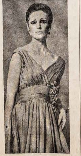
Drabužių modeliotojas Gothe šiam pavasariui pagamino šį lengvą moterišką apėrdalę. Siuvėjai jau gamina suknius dideliais kiekiais, nes tikisi daug pirkėjų.

♦ JUOZAS BACEVIČIUS pildo įvairias INCOME TAXŲ blankas, nereikalinga laukti, palikite žinias, blankos prisiučiamos. Įstaiga veikia kasdien 9—9 val. vak. BELL REALTY, 6455 So. Kedzie — PR 8-2233.