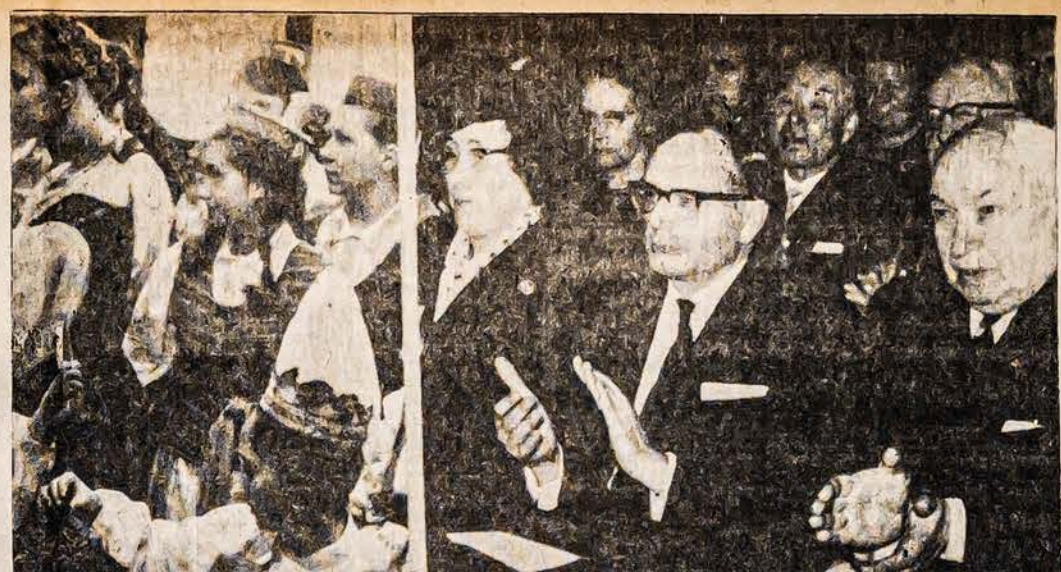
Pirmajam paveiklė: Vokietijoje gyvenančios lietuvių, apsirėdžiusios tautiniais drabužiais, dalyvauja Vasario 16 d. minėjimo šventėje. Antrajame paveiklė: Dr. Richard Jaeger, Vokietijos parlamento viceprezidentas (paveiklo viduryje) dalyvavo Lietuvos nepriklausomybės minėjimo sukaktyje ir pasakė turiningą kalbą.

Naujų administracija turi daug gražių ir nebrangių knygų, kurias galima tik už kelis dolerius įsigyti. Knyga yra geriausias žmogaus draugas, tad ir Tamsta įsigyk bent keletą tokių draugų.