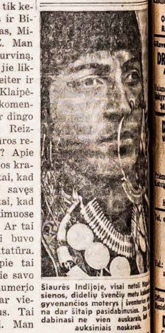
Siaurės Indijoje, visai netoli... sienos, didelių švenčių metu... gyvenančios moterys į šventes... dar šitaip pasidabimus. M... dabinais ne vien auskarais... auksiniais noskarais.