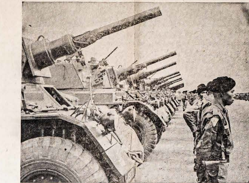
Šiomis dienomis Indonezijos sostinėje įvyko kariuomenės paradas. Prezidentas Sukarno priėmė maršuojančius karius ir ilgą sovietinių tankų eilę. Paveiksle matome sovietų tankus, duotus Indonezijos prokomunistinei valdžiai.

Kinų komunistų laikraštis sako, kad klasės priešai vis kelia palpas, o Formozos kinų žvalgyba tvirtina, kad komunistai padarė klaidą apginkluodami didelės mases kinų ūkininkų, kurie komunistų valdžiai niekad nepriklausė. Kartu su milicijos įsteigimu Kinijoje padidėjęs skaičius ginkluotų užpuolimų, plėtinimų ir žmogžudysčių.