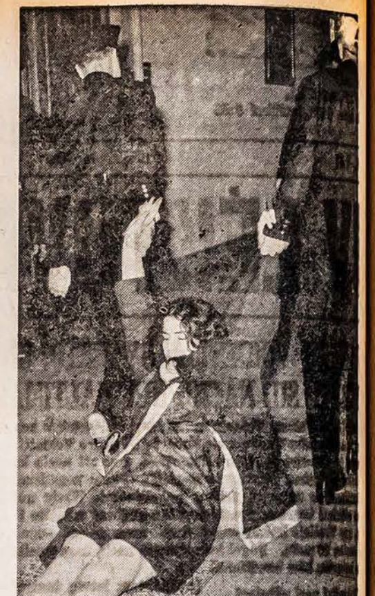
Washingtono, vyr. valstybės gynyboje kelintą dieną laiko vyriausiniai demonstrantai, reikalaujanti, kad federalinė valdžia darų intervenciją Alabamoje. Atėjus laikui uždaryti ofisa, policija demonstrantus turi kas vakarą pro duris vilkite išvilti.

Sovietinis pilietis nieko toje krautuvėj nusipirkti negali, nes