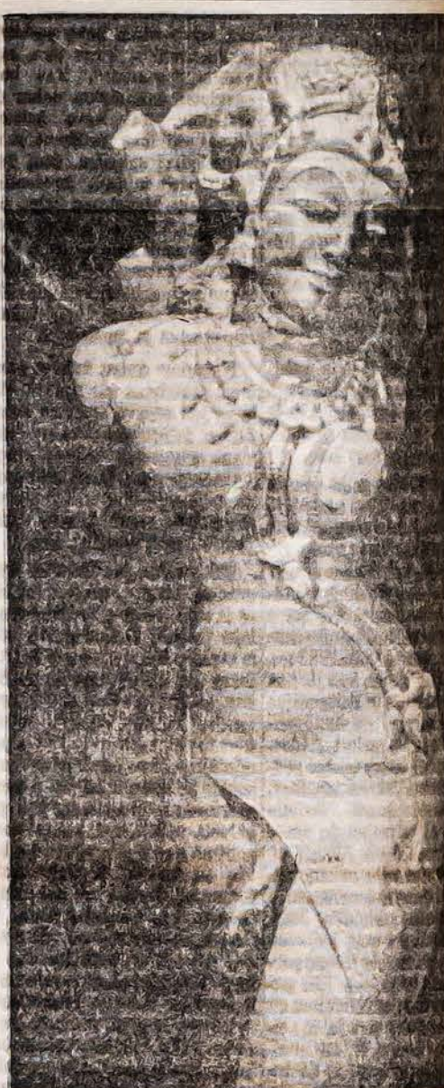
Senoji Indijos deivė Trišaka, kitu vadinama Triakša, Vriškia ir šaka. Deivė buvo judri ir visur esanti. Visur ji vaizduojama su džio. Indai nori pasakyti, kad ji buvo gyva, kaip augantis ir žydintis Nulauzus viena šaka, tuojau atsiradavo atžala, kuri laikui bėgant tapo į gyvą, žydintį medį. Deivė Trišaka vaizdavo launatvę, gyvybę žiną atsinaujinimą. Ši deivė garbinta prieš tris tūkstančius metų stovyly ir gerbėjų yra daug ir šių dienų Indijoje.