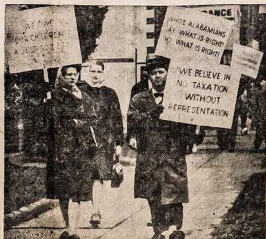
Solma miestelyje susidarė baltų gyventojų grupė, kuri vyksta į Alabamos sostinę prašyti leisti juodiesiems balsuoti. Miestelio gyventojų daugumai nepatinka šie baltieji, reikalaujantį duoti juodiesiems pripažintą teises. Ši grupė mano, kad Alabamoje sugrįš taika, kai juodieji galės balsuoti ir būti išrinkti.

SKAITYK PATS IR PARAGINK KITUS SKAITYTI NAUJIENAS