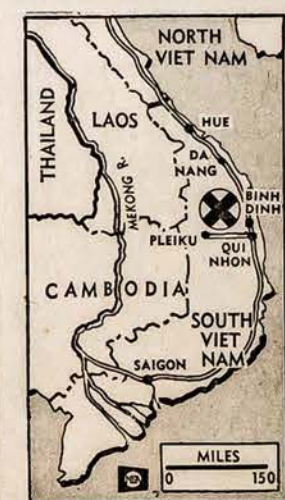
Kryžiuoku paženklinta vieta Vietname, kur komunistai bandė perkirsti tiekimo kelius, bet aviacijos ir vietnamiečių kareivių bendru veiksmu vieta buvo nuo komunistų apvalyta.