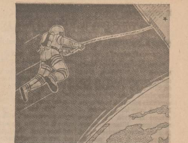
Sovietų kosmonautas Aleksej Leonov 20 minučių skrido su raketą 17,000 mylių greičiu. Jeigu virvė būtų nutrūkus, tai lakūnas Leonov ordvėje būtų skraidęs iki mirties.