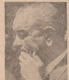
Prezidentas Lyndon B. Johnson kalbasi su laikraštiniškais, atvykusiais į prezidento ūkį. Prezidentas padarė pareiškimus Alabamos ir Vietnamo klausimais.