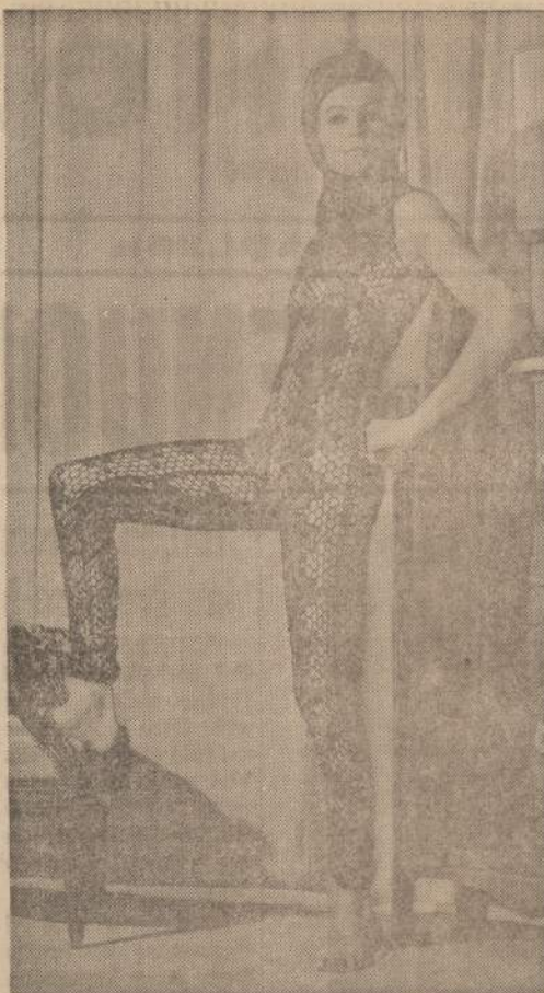
Paryžiaus madų gamintojas Jacques Heim pasiūlo jaunoms moterims pakeičti matomą apvalkalą, kuris permatomas, bet labai patogus rytais būti namie.

Minėtas plaučiuose kraujotakos sulėtėjimas neišvengiamai padidina kraujospūdį plaučių arterijoje, kurį į plaučius ateina iš dešinės širdies pusės (d. skilvelio) ir atneša veninį kraują prisisūrbimui deguonies. Tas iš dešinės širdies į plaučius einančioji arterijoje padidėjimas kraujospūdžio galima prilyginti ledais užsikimšusiai upei pa-