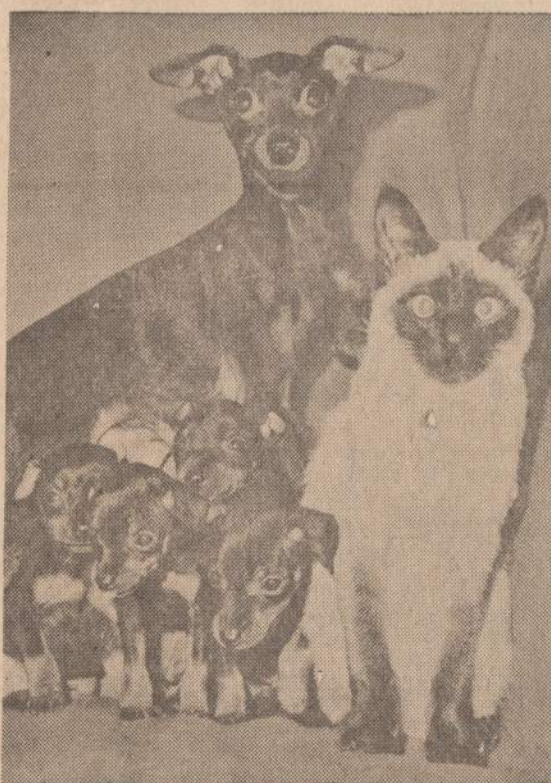
Šis šunytis niekad nesipyko su katinu ramiais laikais. Gerai draugais įjėdu liko ir dabar, kai šeima žymiai padidėjo.

— Trečiądienį, kovo 24 d., 7 val. vakare Holy Trinity aukšt. mokyklos auditorijoje, 1443 W. Division St., Chicagoje, "Ateities" Atžalynas atliks programą su lietuvių tautiniais šokiais. Vakaraų ruošia "American