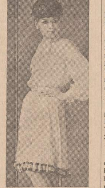
Paryžiuje ne taip žalta, kaip Chicagoje. Ten jaunos moterys jau dvi pavelsle matomas suknelės.