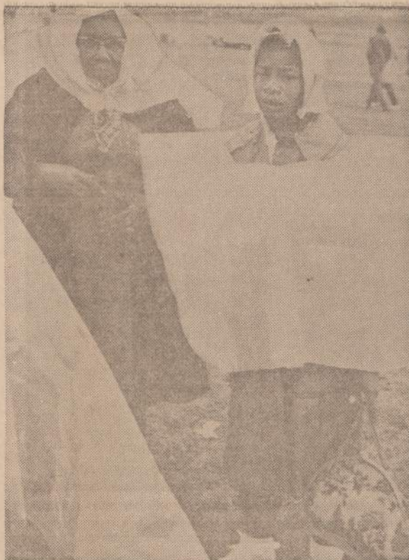
Iš Selmos keliautojos išėjo labai linksmos, bet kelionėje paaiškėjo, kad Montgomery miestas labai toli. Pirmiausia keliautojoms pradėjo skaudėti kojas, o kai pradėjo plūti lietus, tai nebuvo kur prisėsti ir kuo prisidengti. Keliavimai bando dangstyti plastikiniais maišeliais, bet jie nuovargio nenuvairia.

Viena moteris iš Washingtono rašiusi daktarui: "Mane ste-