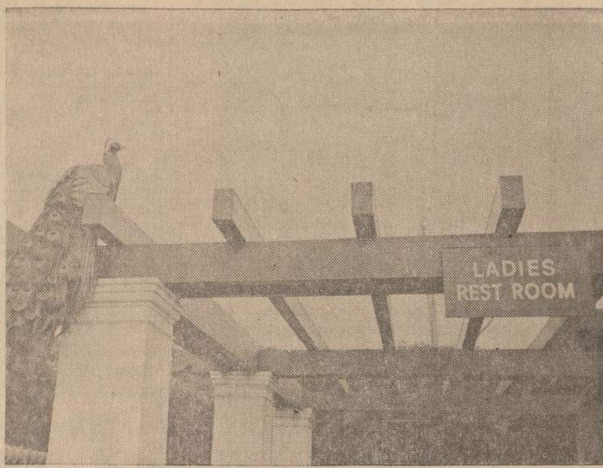
San Francisco zoologijos sode įtaisyta didelė iškaba, kad nosį pasipudruoti norinčios moterys laikai lengvai galėtų susirasti moderniškai įrengtus kambarius.

SIUNTINIAI IŠ CHICAGOS TIESIAI I LIETUVĄ Didelis išpardavimas, pav., 5 kostiumams medžiaga tik $21.00, Angliška medžiaga kostiumui $10.00 ir visa eilė kitų prekių sumažintomis kainomis. Taip pat siunčiamos rašomos, siuvamos mašinos, akordeonai, foto aparatai ir net pianinai. Ką besistumėt, teiraukitės Lietuvių Kompanijoj WORLD PARCEL SERVICE CO. 2715 WEST 71st STREET CHICAGO, ILLINOIS Tel.: 471-1424