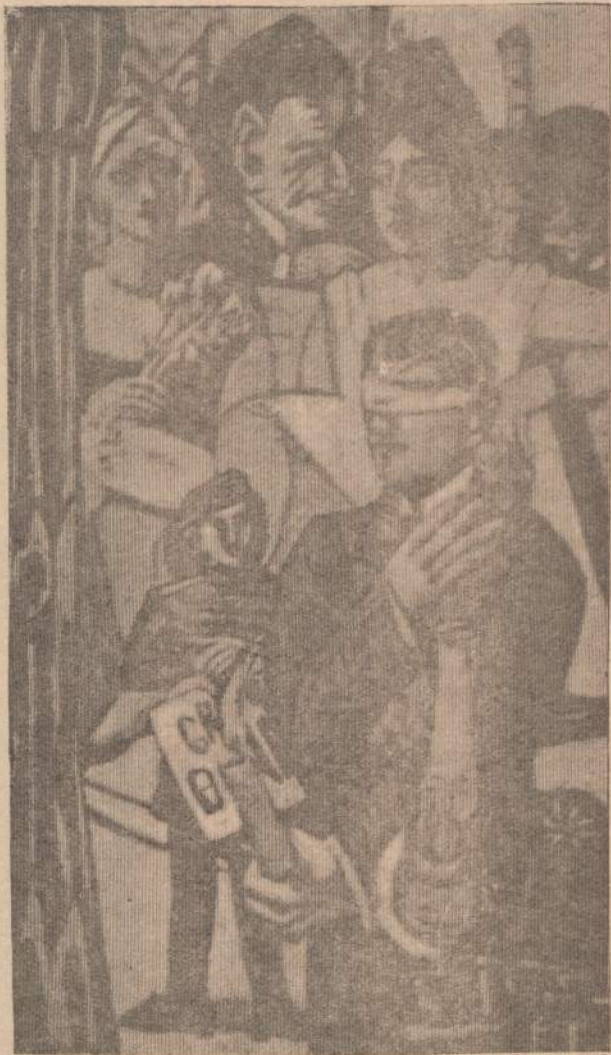
Max Beckmann. Triptiko „Apakimas“ dešinioji dalis, dabar parodoje Art Institute

Max Beckmann plačios vaizduotės menininkas, heroiško gyvenimo įvykių kūrėjas, vienas didžiausių ekspresionistų. Jo piešinys laisvas, beveik eskyziškas, komiški ir tragiški charakteriai triumfuoja jo milžiniškuose triptikuose. Spalva: tamsios gilumos, juodos, mėlynos, raudonos, mažai žalios, dar mažiau geltonos spalvos. Spalvų taupumas užleidžia piešiniui ir pačiam vaizdui pirm-