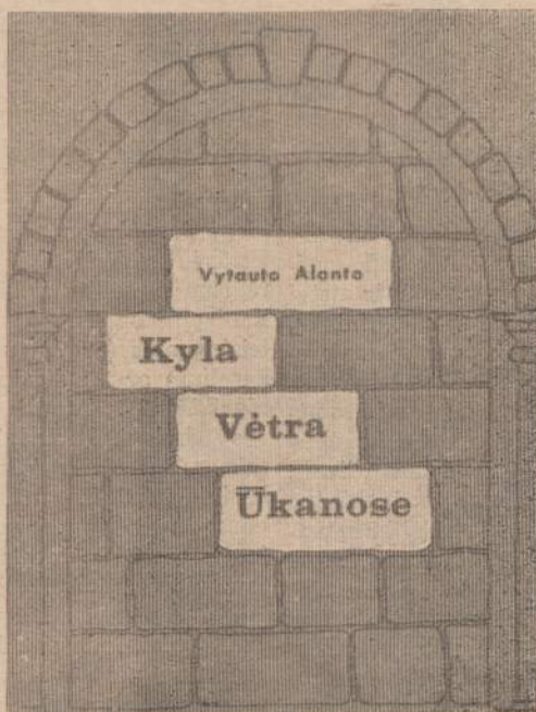
A. Žaliūno pieštas programos viršelis. "Kyla vėtra ūkanose" Dramos Sambūris vaidino Vasario 16 gimnazijos naudai. Režisavo D. Mackialienė.

Meniškos programos — patrauklios reklamos