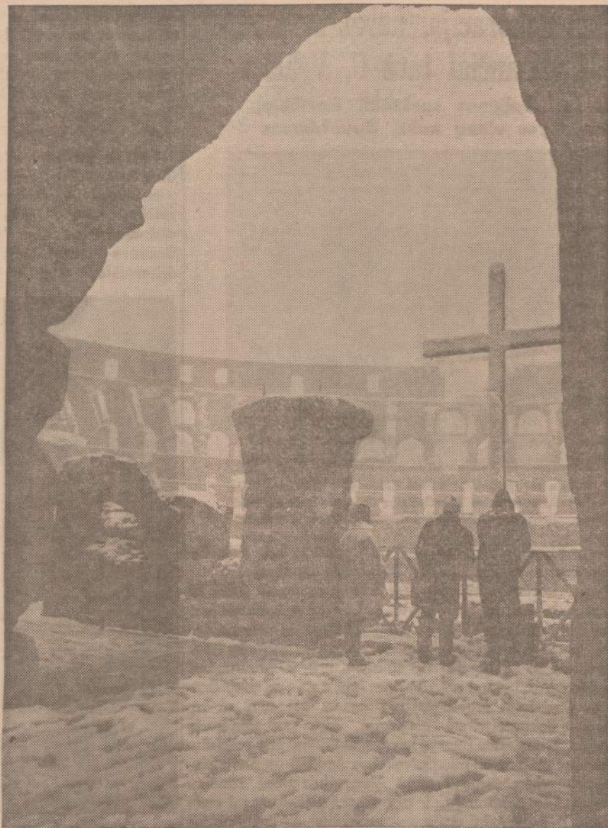
Prieš krikščionybės laikus statytas romėnų koliziejus praeitą savaitę gavo storą sluoksnį sniego. Pagonių romėnų pastate dabar jau pastatytas didelis kryžius.