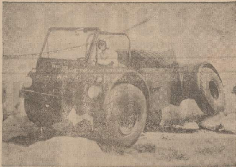
Naujausias automobilis, angliškai pavadintas "Sidewinder". Jis gali važiuoti bet kokiais keliais ir pašlaitėmis. Motoras stumia visus keturis ratus. Jeigu yra reikalo, tai mašinos sunkumą galima pernesti į kitą automobilio pusę ir lipni gana stačiomis pašlaitėmis.

— Arba, žiūrėk, vėl... Tos vaikų varžybos, rodos, kad niekis — padeklamuoti eilėraščių ar paskaityti kokią pa-