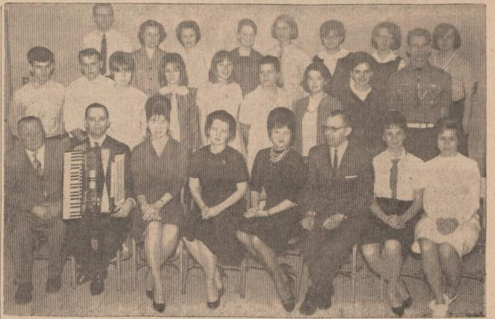
BŪSIMIEJI NAUJI TAUTINIŲ ŠOKIŲ MOKYTOJAI