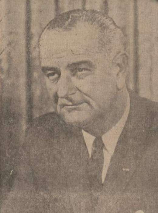
PREZIDENTAS LYNDON B. JOHNSON

LISABONA. — Portugalijoje buvo suimti šeši studentai už tai, kad jie priklausė komunistų partijai. Studentai teisme pasiskundė, kad juos policija mušimais privertė prisipažinti komunistais, nors jie tokie neesą.