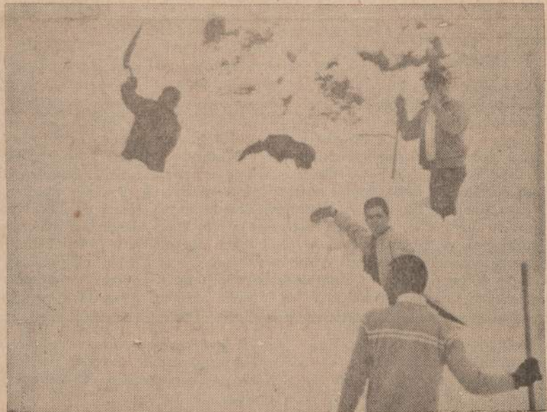
Kalifornijos kalnu pašlaitėmis jaunimas čiuožinėjo, o kai priartėjo prie Baldy kalno, tai krito didelis sniego gabalas ir užvertė kelis čiuožėjus. Paveikslė matome kitus čiuožėjus, bandančius išgelbėti užverstuosius. Pavyko visus atkasti. Vienam buvo nulažta koja, o kiti trys išgelbėti sveiki