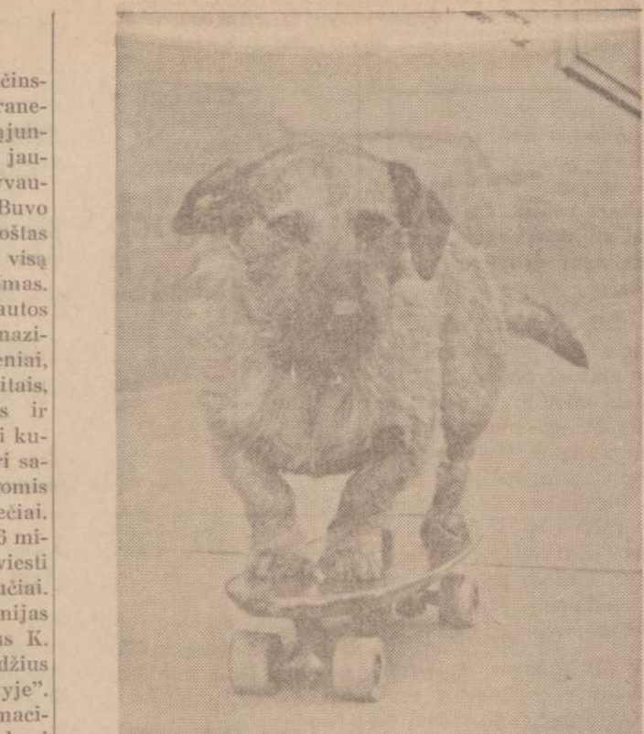
Šis žuniukas, vardu Tigras, gyvenantis Porlande, Oregon, išmoko važinėti rateliais ir dabar jais net scenoje parodoja.