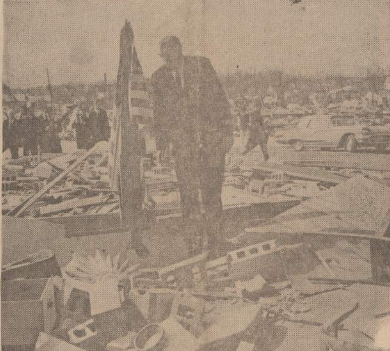
Prezidentas Johnsonas trečiadienį aplankė Indianos, Michigano ir Minnesotos valstybes, kad galėtų savo akimis pamatyti viesulo, lietaus ir pakilusiu upių vandens padarytus nuostolius. Paveikslė matome prezidentą, apžiūrinėjančią sugriautus namus Dunlap, Ind., miestelyje.

namo plane neesmingų skirtumų nuo prezidento Ho Chi Ming prieš kelias dienas pasakytos kalbos.