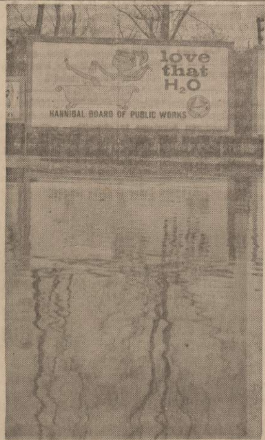
Ankėčiau Hannibal, Mo., gyventojams būvė patariama bereikalingai netaisyti geriamo vandens, o dabar Mississippi vanduo jau apėmė šio miestelio gatvės. Pakilęs vanduo padarė nuostolių ir sukėlė susirūpinimo.