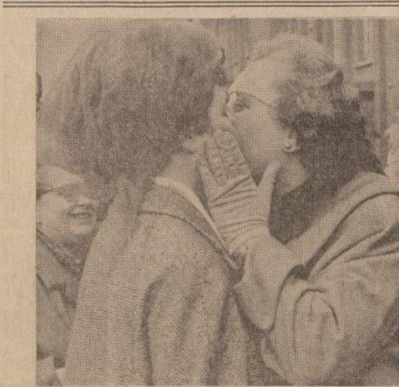
Vėlyku įvenčiams komunistai nutarė atidaryti vartus ir leisti rytiečiams aplankyti vakarų Berlyne gyvenančius savo gimines. Paveikslo matome rytų Berlyne likusią motiną, sveikinantią ir vakarus pabėgusią ir Berlyne gyvenantią josios dukrą.

— Raseinių fabrikas "Satrija" gavo užsakymą pagaminti 8,000 tautinių kostiumų šokėjams ir daininkams. Jiems teks pasirodyti liepos mėn. rengiamoje dainų šventėje. (E)