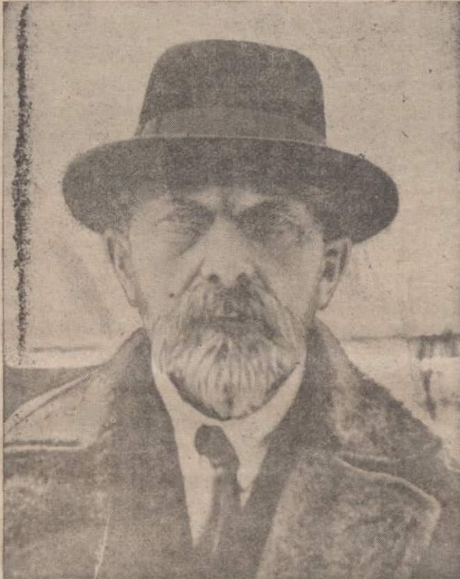
Jei po amžių kada skaudūs panciai nukris Ir vaikams užtekės nusiblaives dangus, Mūsų kovos ir kančios, be ryto naktis — Ar jiems besuprantamos bus?