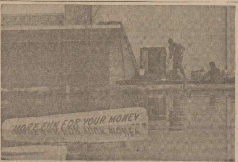
East Moline, Ill., buvo vieta, kurioje žmonės galėjo laisvus vakarus praleisti. Prieš savo įteigą ji turėjo skelbimą, matomą šiame paveiksle. Bet pakites Mississippi vanduo ne tik įstaigą apsemė, bet ir iškabą baigia apsemti. Dabar ją skaito vyrai, kuriems tenka sunkus darbas — sulaukyti kylančią Mississippi vandenį.

1739 So. Halsted Street Chicago 8, Illinois