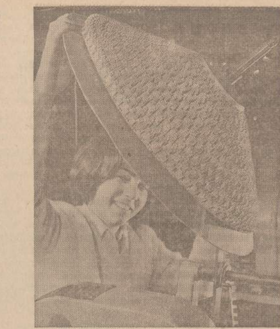
Atrodo, kad ši jauna pana maunasi modernią vasaros skrybę, bet tai ne tiesa. Prieš akis matome Honeywell bendrovės pagaminta modernią skaičiuotoją, kurį reikia įjungti į automatines mašinas.

A. Bimba tokio „pakvietimo arba prašymo“ laukia seniai. Jisai buvo labai nusivylęs, kad Šiaurės Vietnamas nesaudė iš amerikiečių, kai tik jie ėmė