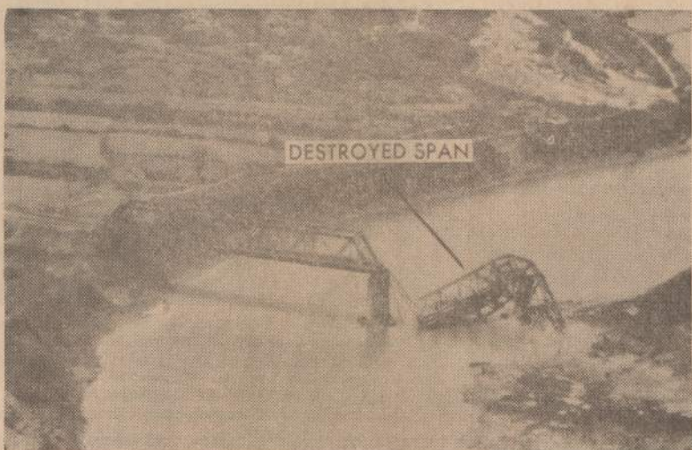
Komunistų valdomo šiaurės Vietnamo geležinkelio tiltas ties Qui Vinh miesteliu. JAV lėktuvams paleidus porą bombų į vieną tilto galą, tiltas suklebė. Panašiai buvo sugadinti ir kiti šiaurės Vietnamo tiltai.