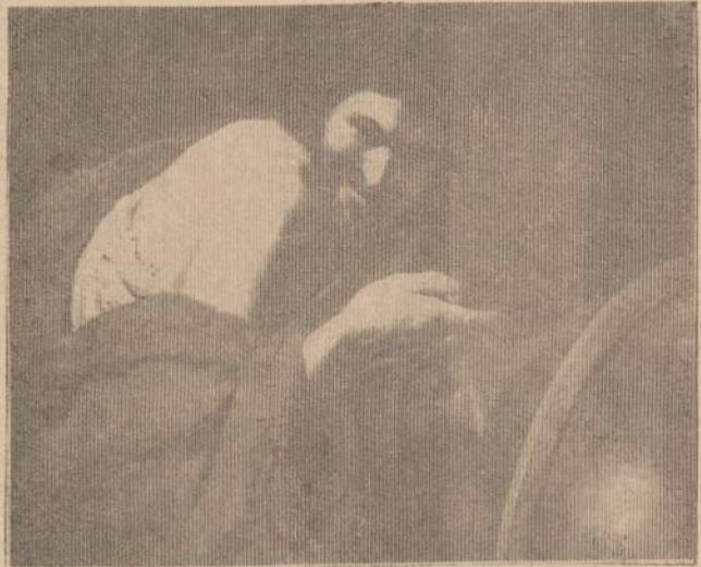
J. RIBERA (1588—1656)

Geležinė skulptūra sunkiai suabstraktinama dėl to, kad ši medžiaga artimesnė statybai, įvairiems išdarbiams — mašinoms ir t. t.