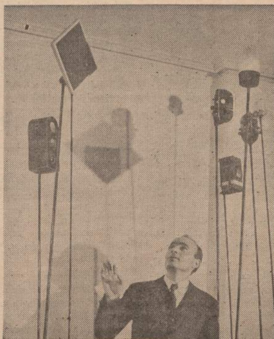
Graikų menininkas Takis pagamino šiuos meno darbus, pavadindamas juos „Signalais“. Jie toki realūs, kad rodo ne tik raudonas, bet ir žalias spalvas. Jis nepasakė, kad elektros laidai eina kartimis.

„NAUJIENOS“ BOLŠEVIKAMS YRA RAKŠTIS JŲ AKYSE