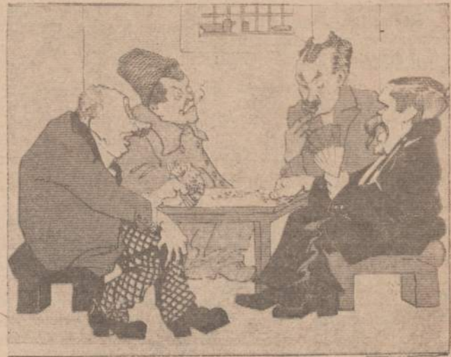
Dailininko Adomo Varno šaržas Matematiko sielvartai Tarybų rojuje: 9 čirvai be 6.